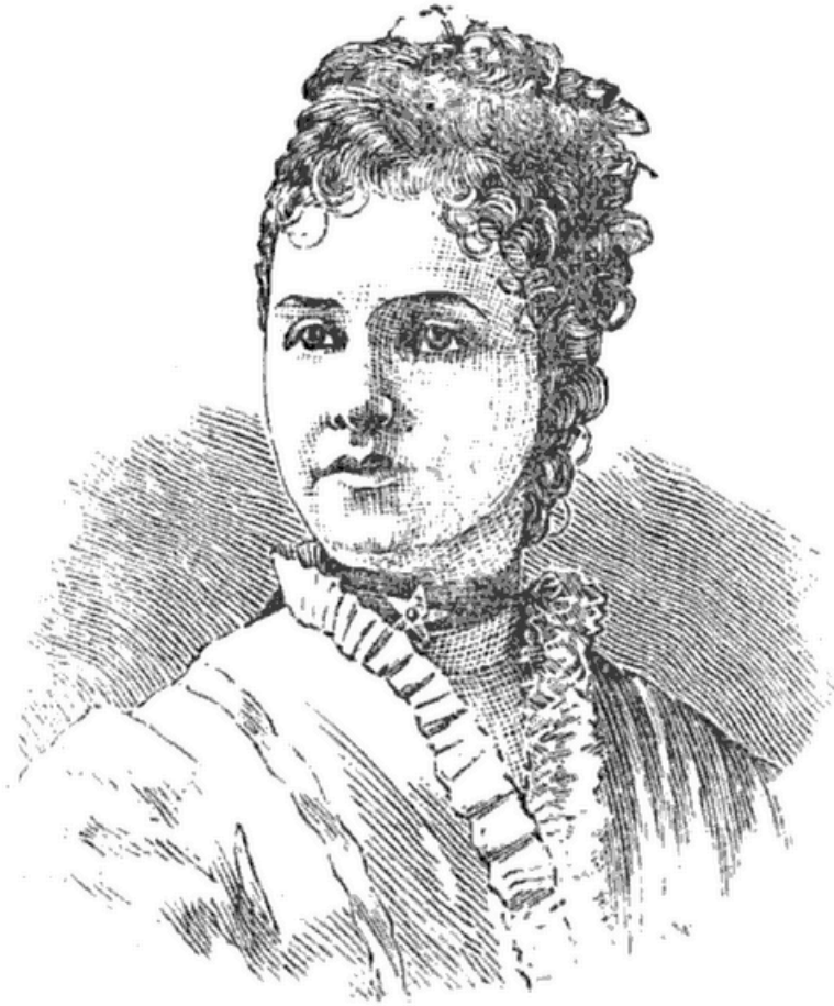
ALBANI (EMMA LAJEUNESSE.)