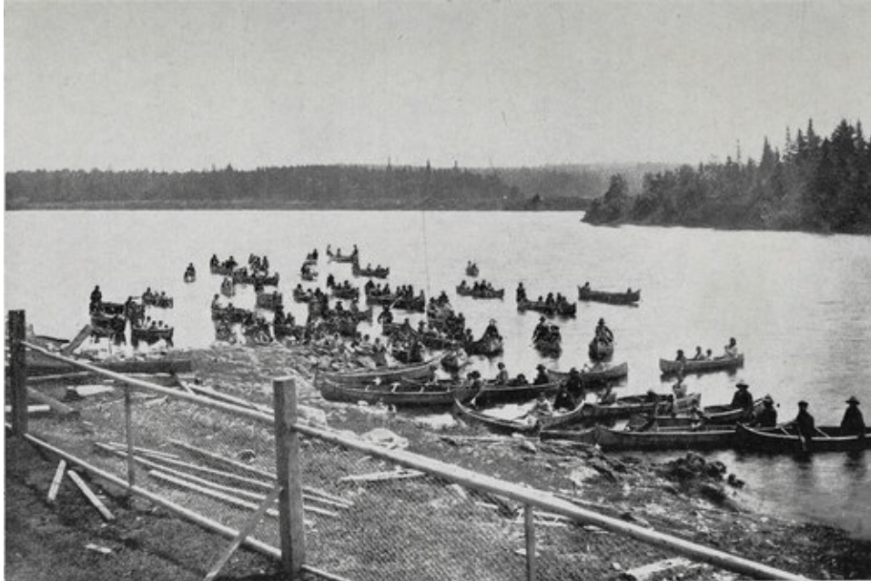
La mission au grand Lac Victoria. Arrivée des familles sauvages dans leurs canots.

arbres, correspondant aux changements dans la nature du sol et leur position, selon qu'ils croissent sur des sommets arides ou dans les vallées fertiles.