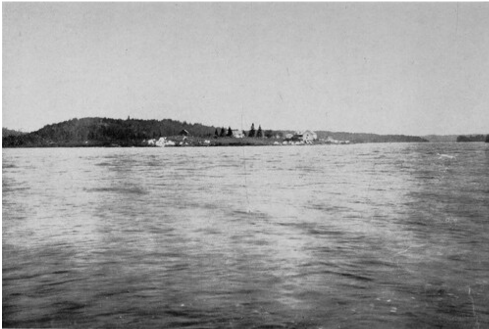
Vue Générale du Poste de la compagnie de la Baie d'Hudson au Grand Lac Victoria. À gauche, décharge de la rivière Ottawa dans le même lac.

Dans les baises, le long des lacs et des rivières, c'est l'épinette noire qui domine ; les arbres sont très longs dru plantés, au point de s'entretoucher. Le pin qui est un peu dispersé pourra s'exploiter simultanément avec l'épinette et d'une manière profitable.