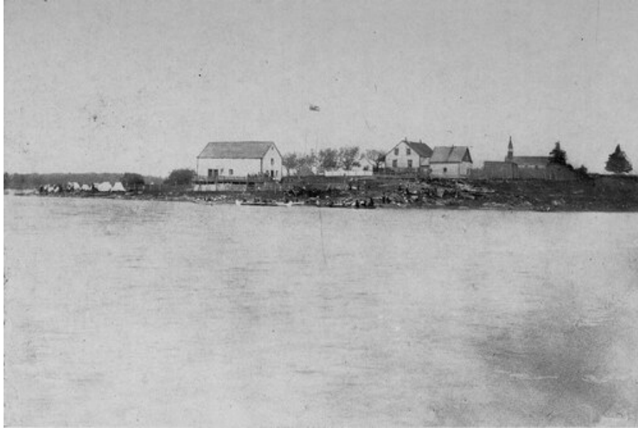
Poste de la compagnie de la Baie d'Hudson au Grand Lac Victoria.

Voilà autant d'industries qui se développeront concurremment avec l'agriculture dans cette région, et qui retiendront auprès de nous ceux de nos compatriotes qui ne se sentent pas la vocation de colon.