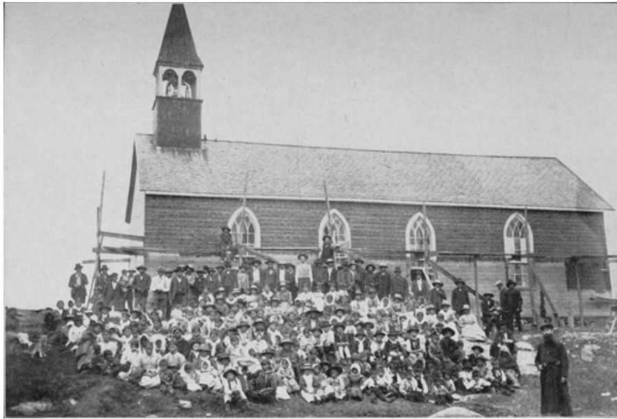
Chapelle du Grand Lac Victoria avec les Indiens de la mission.