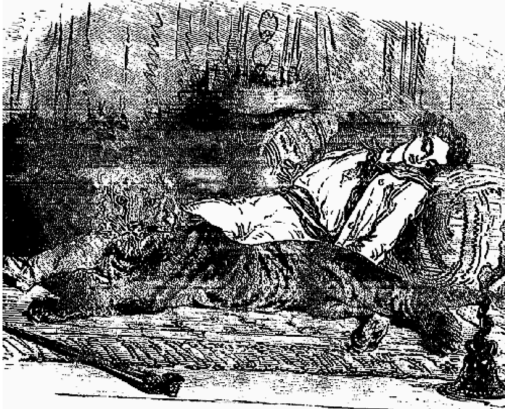
Il alla tranquillement se coucher.

—Oui, dit Holkar. Ce moricaud est un homme sûr qui sert de messenger à mon ami Tantia Topee.