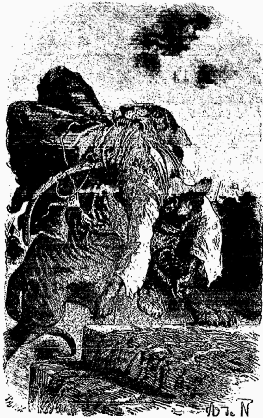
Elle saisit le malheureux par la ceinture.