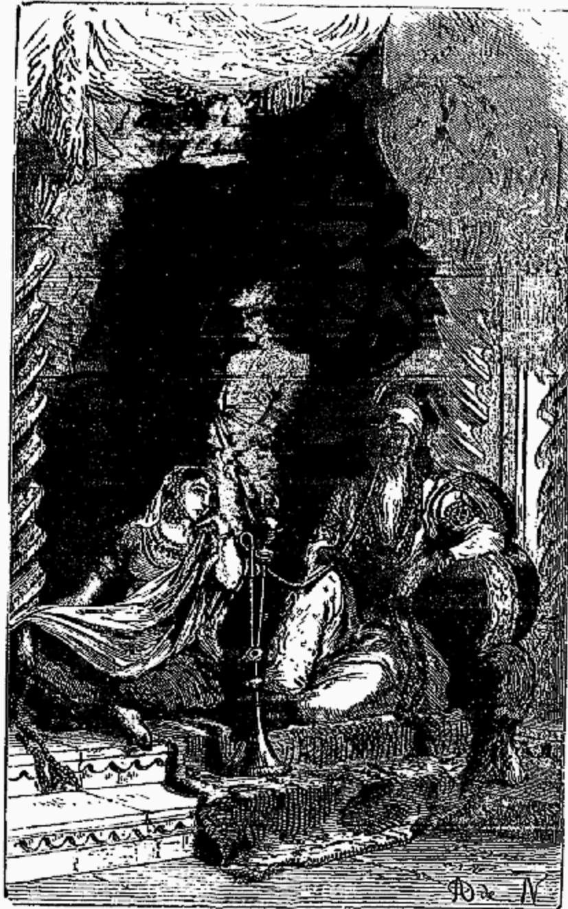
Holkar était assis sur un tapis de Perse.

«Que la volonté de Brahma s'accomplisse!» dit-il enfin en répondant à sa pensée intérieure.