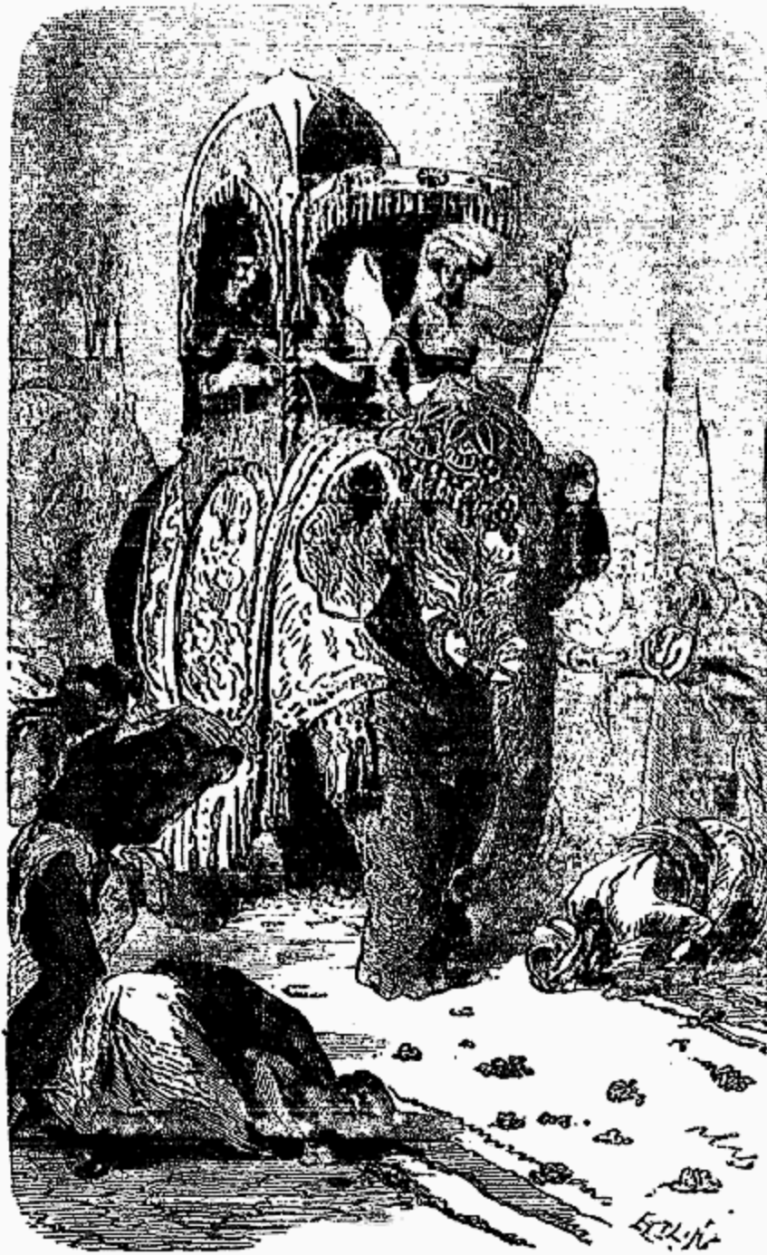
Fêtes du couronnement.

On juge aisément de quelle ardeur de vengeance elle était animée. Elle courut tout d'un trait à Bhagavapour, et sans s'occuper des détails de la fête, elle enfonça d'un choc enragé la porte de la maison de Lakmana, chercha