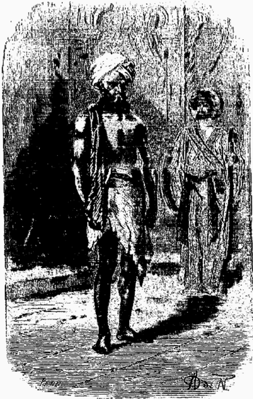
C'était un fakir à demi nu.

«Ne veuille donc pas encore t'en aller de ces lieux: demain tu partiras, mon fils, avec ta mère et moi.»