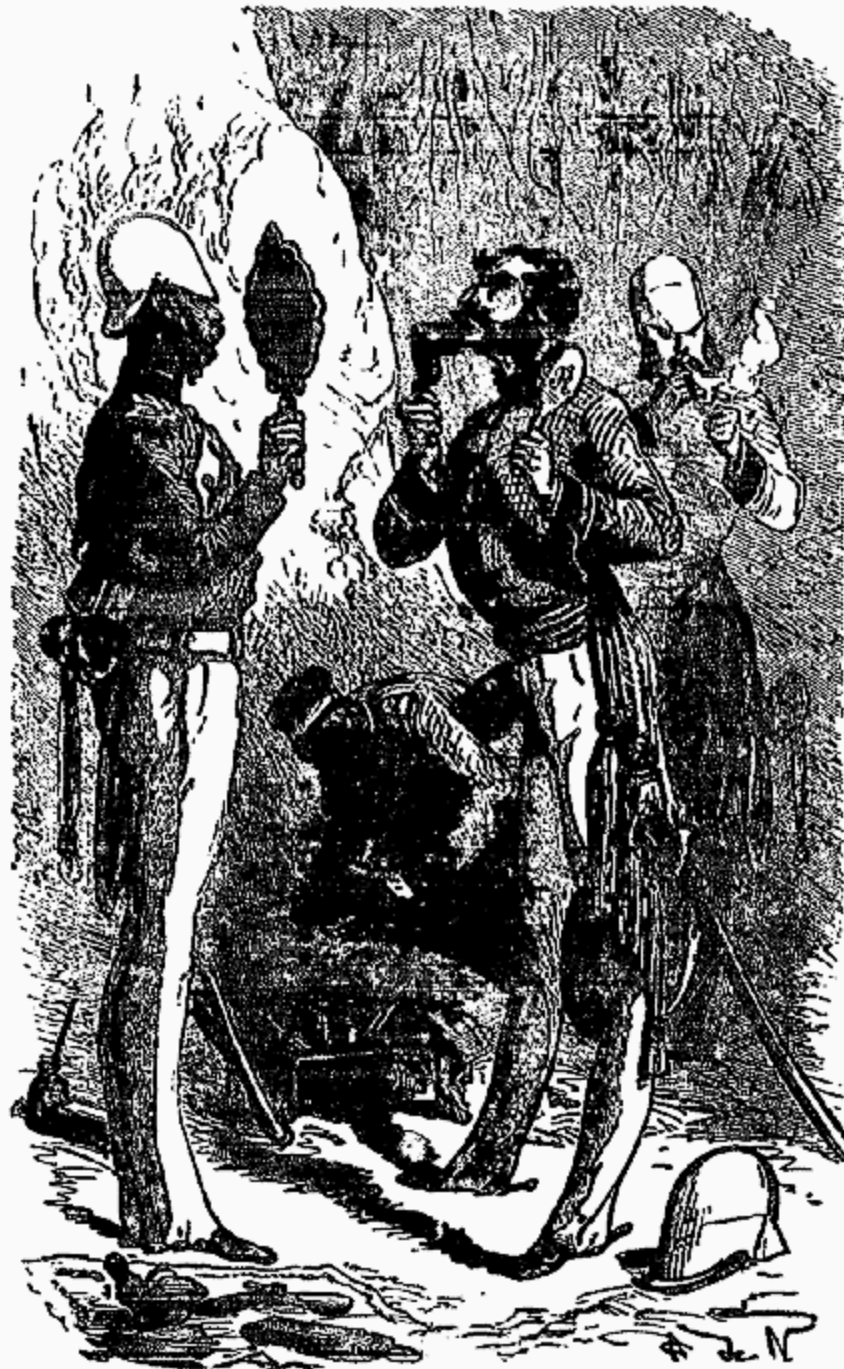
Préparatifs de combats de sir John Robarts.