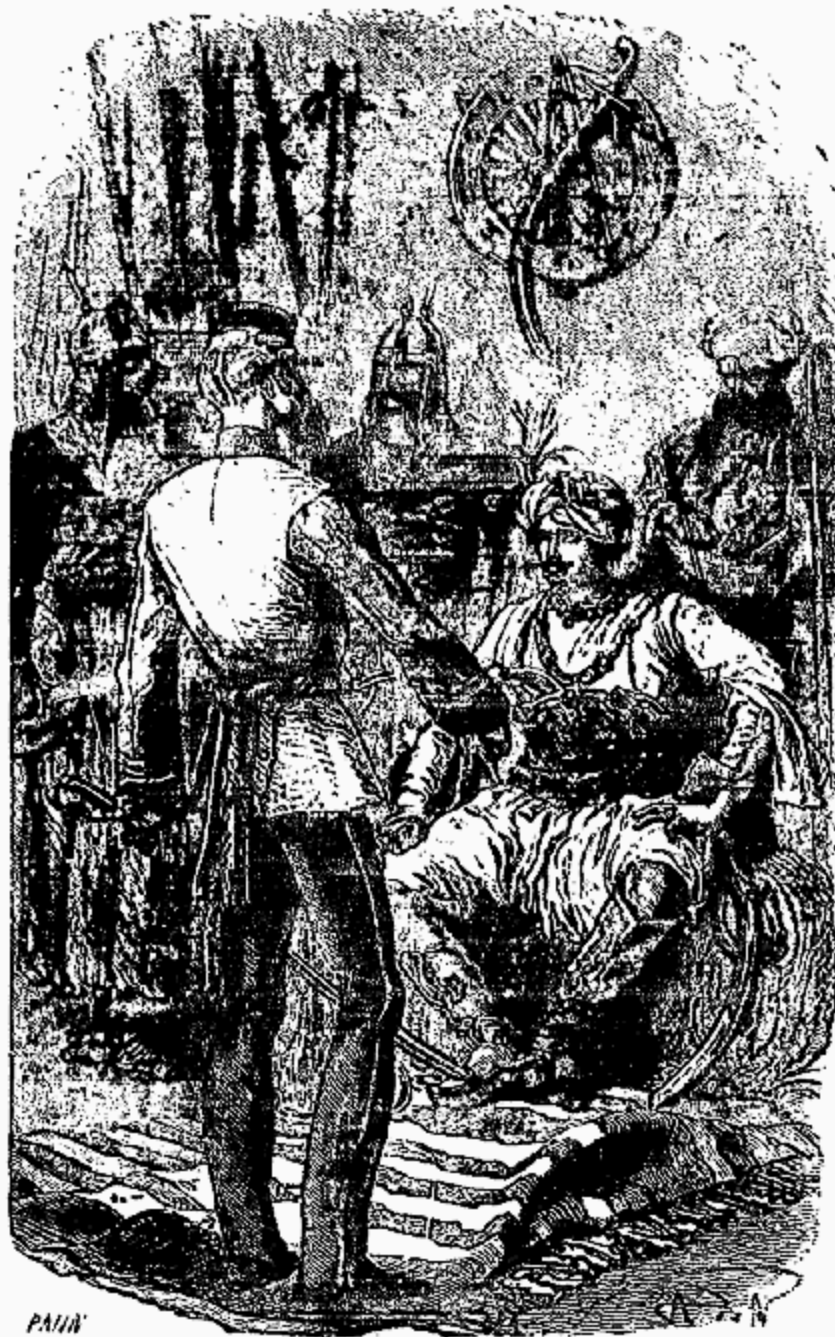
Celui-ci se présenta d'un air rogue.

—Ah! ah! dit Corcoran, le colonel est bien bon, et je vois qu'il a songé au solide. Voyons la conclusion.