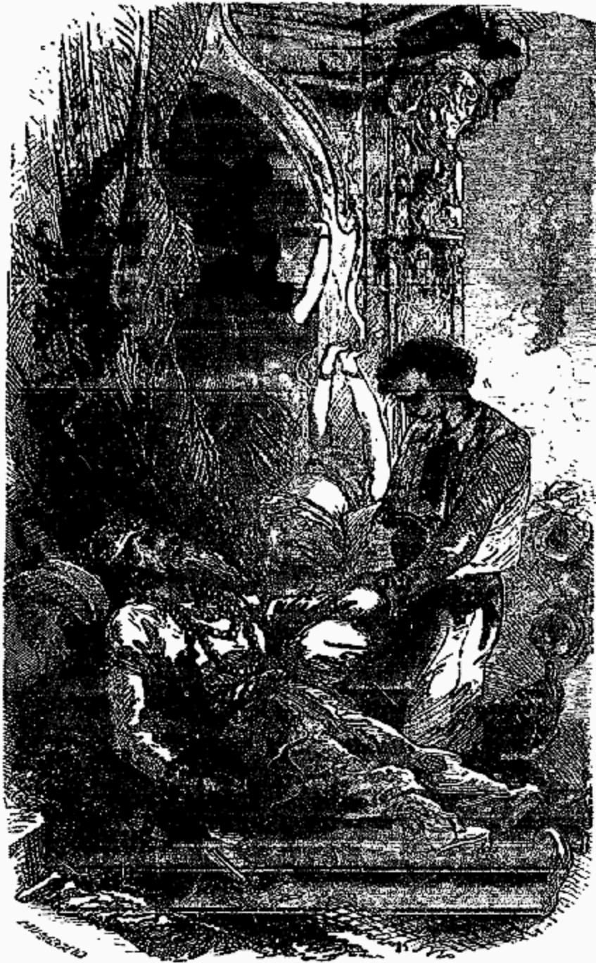
Vers la fin du jour, Holkar mourut.