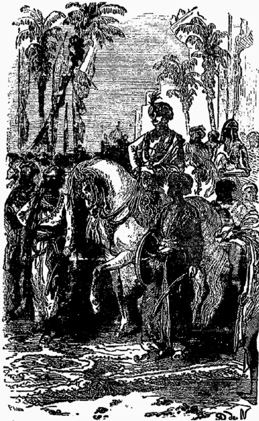
Triomphe de Corcoran.

Ici Sougriva se mit a rire en silence à la manière des Indous et montra deux rangées de dents blanches.