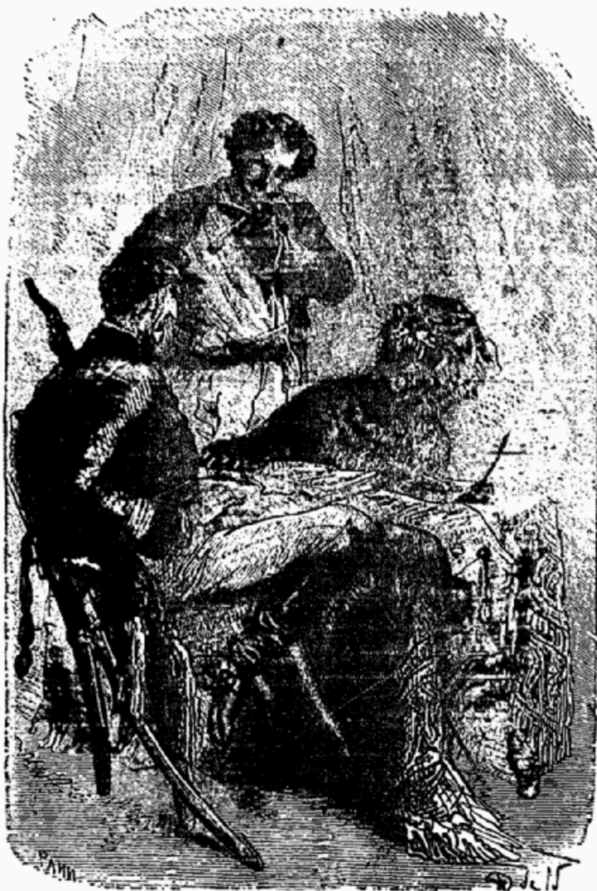
La tigresse se leva et se montra.

—Encore ce mot-là, colonel! dit Corcoran. Eh bien, ne faisons aucun traité, aussi bien n'en ai-je pas besoin. Debout, Louison!»