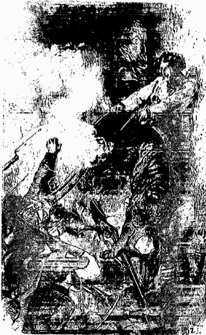
Siège de l'escalier.

—Si l'on vous prend de force, vous serez fusillé.