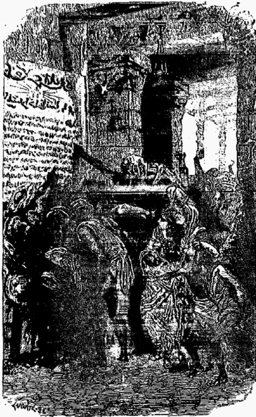
Proclamation de Corcoran.