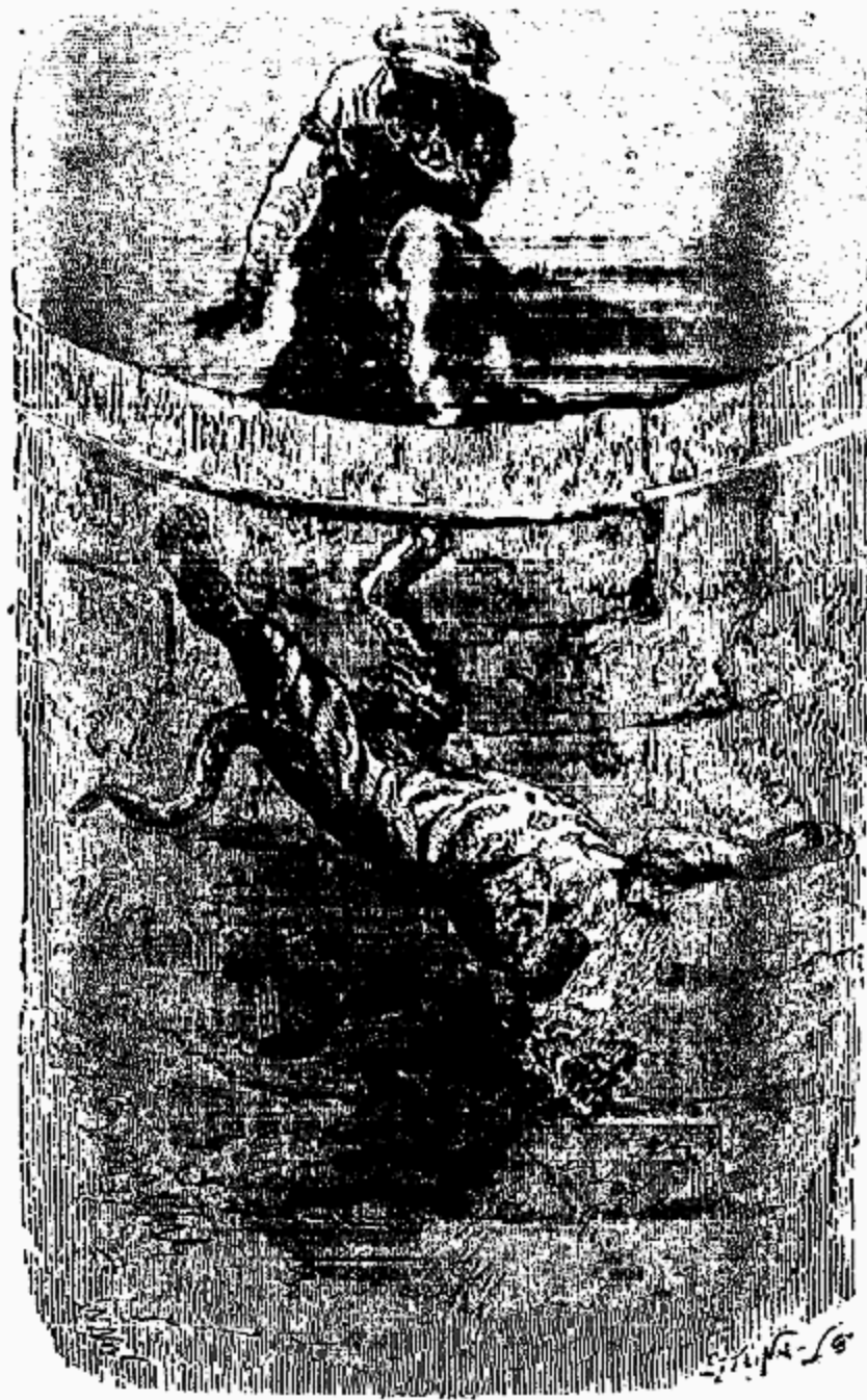
Il se pencha sur l'ouverture.

Tout était prêt. Il avait fait périr le seul témoin de ses actions dont il dut craindre le témoignage ou les griffes, et le jour du crime approchait. Corcoran, occupé d'autres soins et le croyant parti pour Bombay, se félicitait d'une fuite qui le dispensait de punir un conspirateur. Mais un sentiment