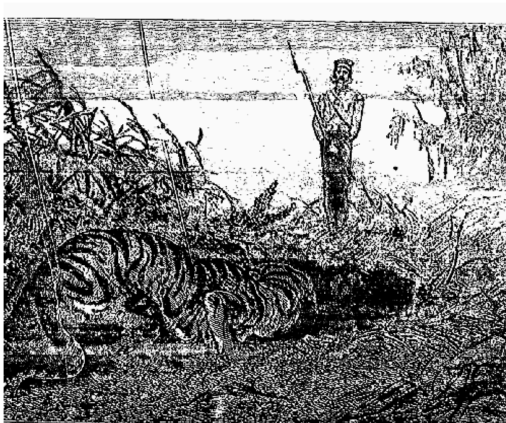
La sentinelle anglaise veillait.

Au reste, la tigresse était si intelligente, qu'elle devina tout de suite le but de sa sortie; elle se coula joyeusement par la porte entre-bâillée, et fut suivie de Sougriva.