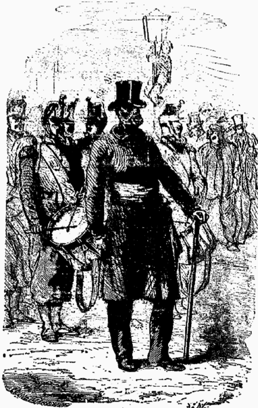
Tout à coup, un commissaire de police...

—Surtout, capitaine, pas d'imprudence!» dit le président en lui serrant la main et lui disant adieu.