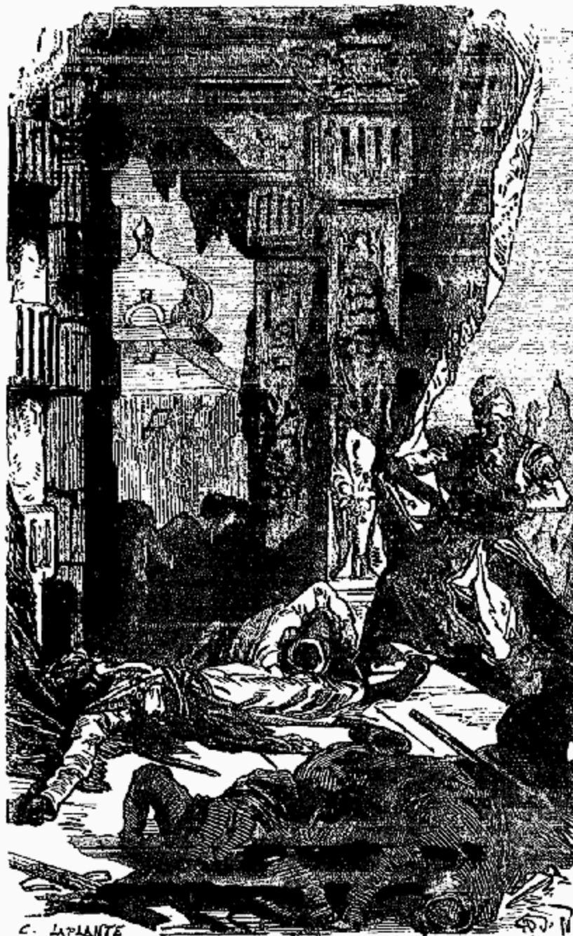
Les escaliers et les galeries étaient jonchées de cadavres

—Hélas! seigneur Corcoran, répondit Ali, ces bandits, pour assurer le succès de leur crime, avaient mis le feu dans cinq ou six quartiers de la ville; mais on l'a bientôt éteint.