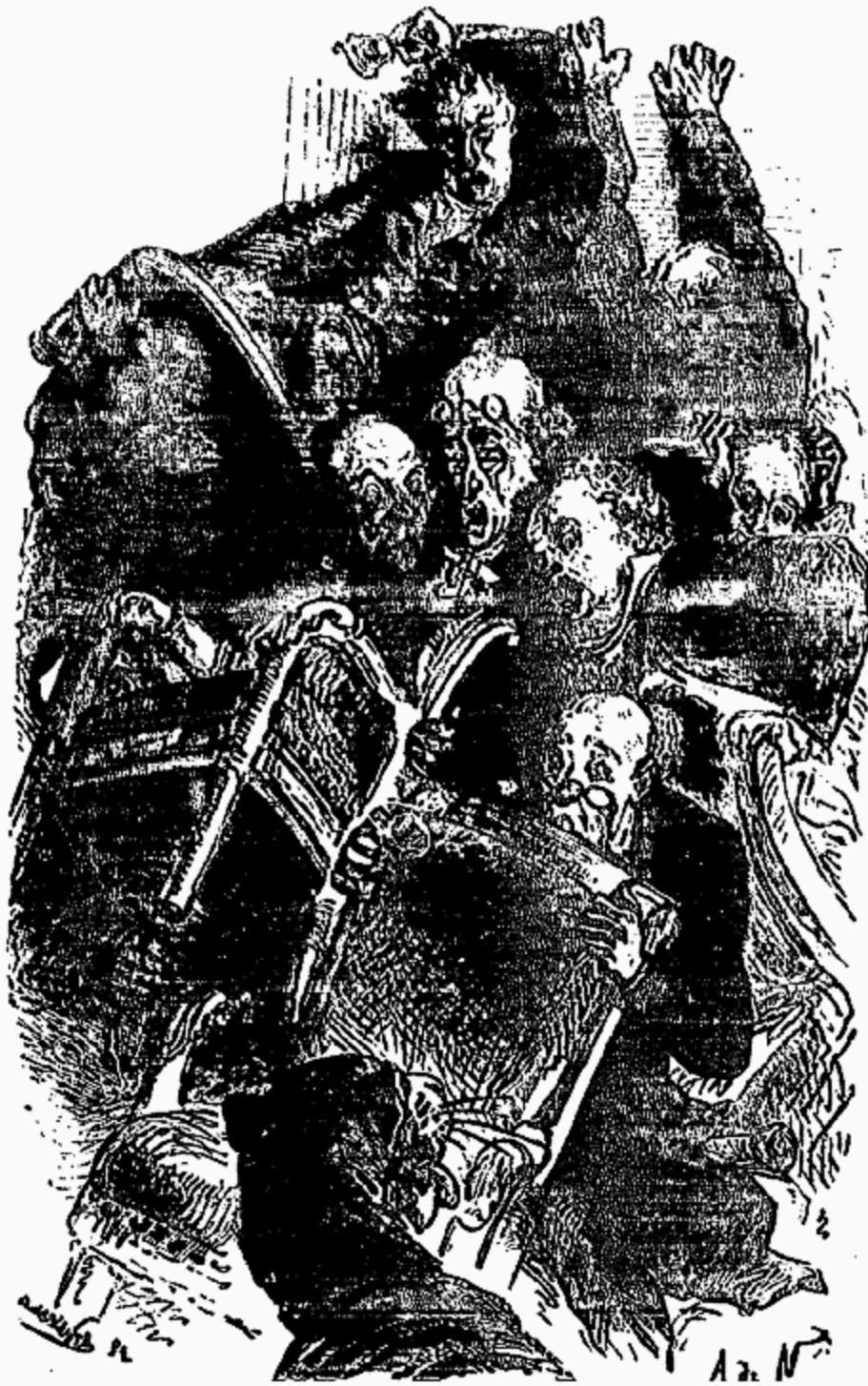
M. le secrétaire avait laissé glisser sa perruque.

Le président eut un mouvement de générosité.