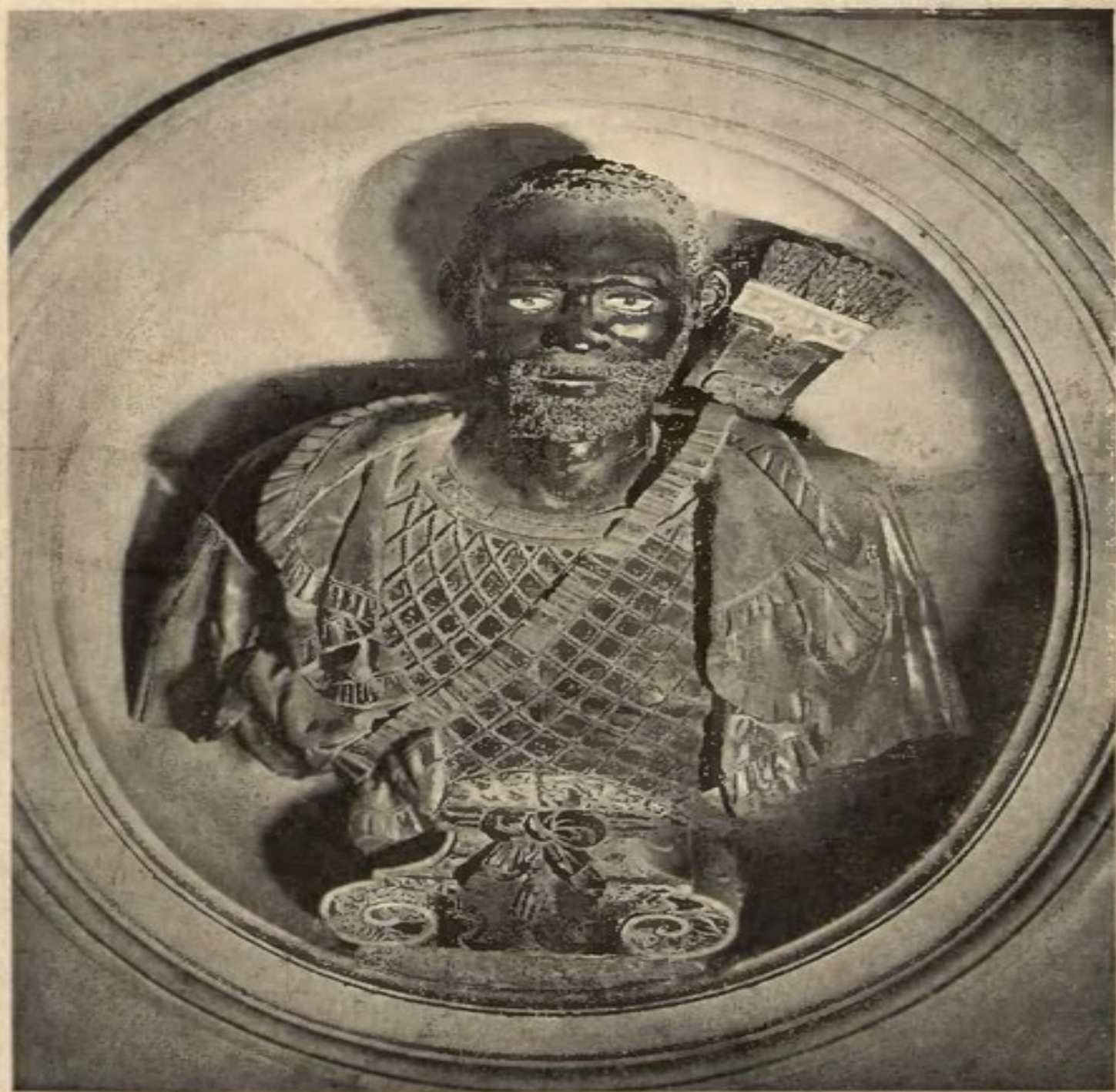
ANTOINE EMMANUEL DE FUNTA AMBASSADEUR DU CONGO AUPRÈS DU PAPE PAUL V BORGHESE