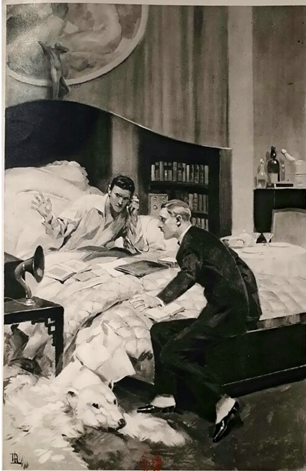
LA PRÉFECTURE DE POLICE... ALLO !... ALLO !... MONSIEUR, UN INCENDIE... (Page 14.)