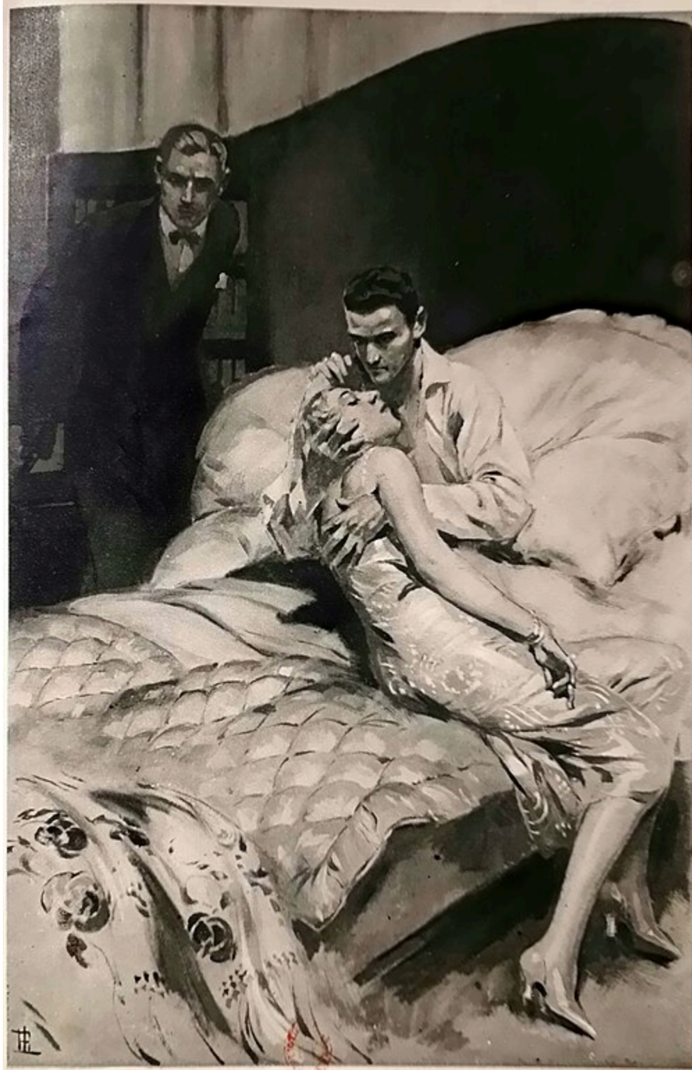
LES BRAS SE REFERMÈRENT SUR ELLE, L'ÉTAU L'EMPRISONNA. (Page 19.)