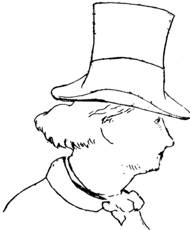
Peint et gravé par Manet 1862.