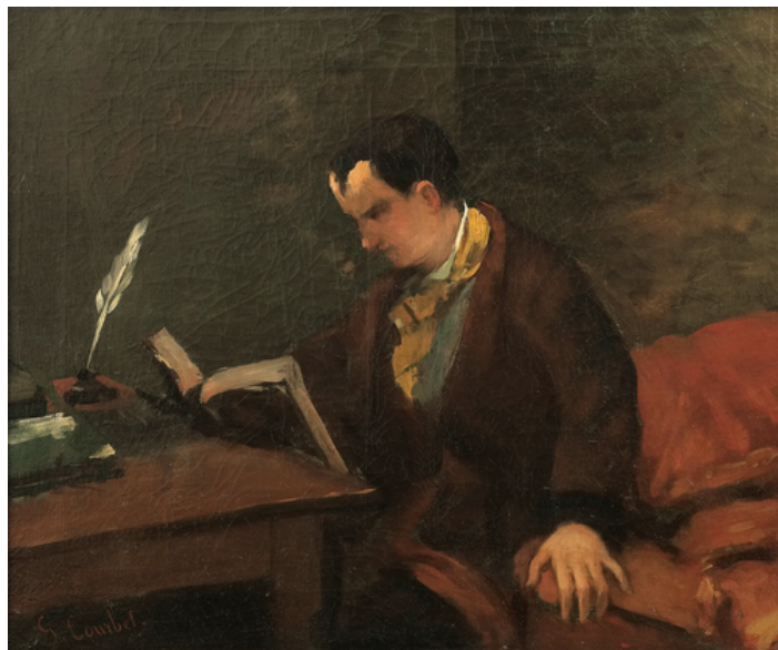
Peint par Courbet 1846.