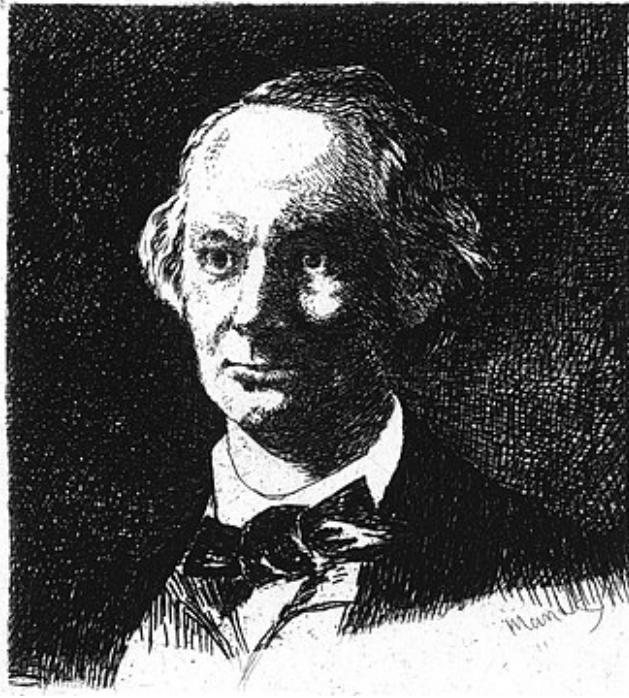
Peint et Gravé par Manet 1865