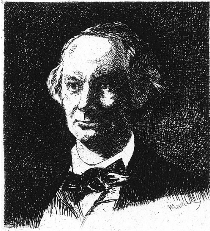
Peint et Gravé par Manet 1865