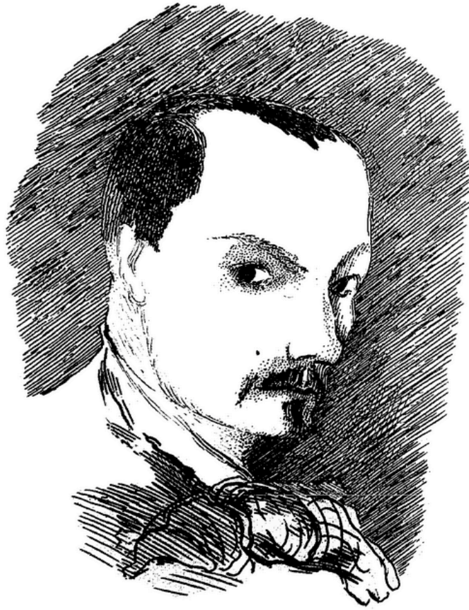
Dessiné par Baudelaire 1848