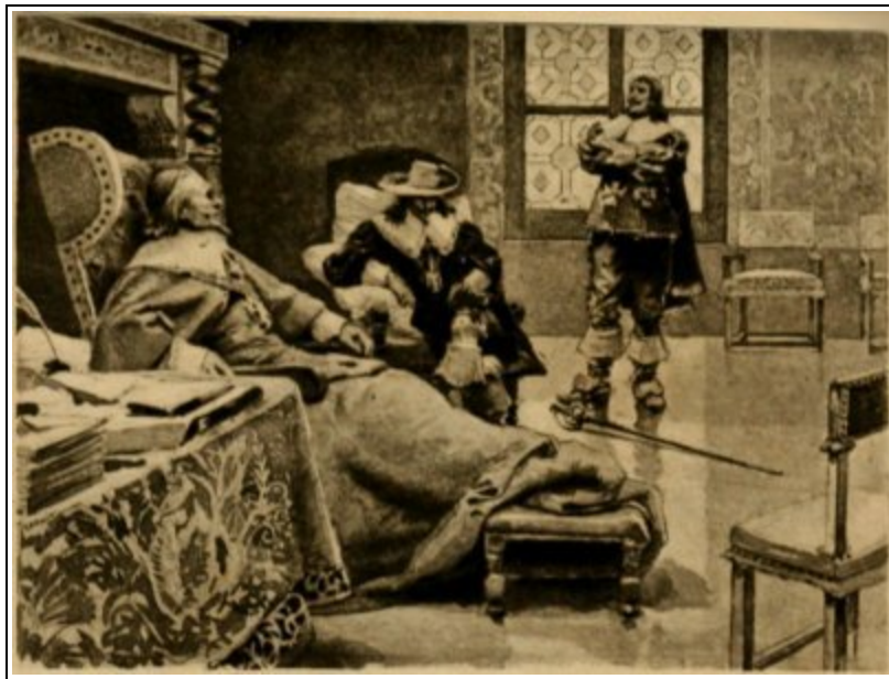
Jeannot del. Héliogr. Dujardin.

Le Grand-Écuyer était d'une pâleur égale à celle du Roi; et, sans daigner répondre à Richelieu, il s'avança d'un air calme vers Louis XIII. Celui-ci le regarda comme regarde un homme qui vient de recevoir sa sentence de mort.