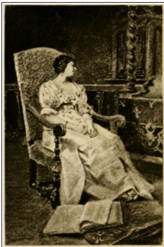
Jeannot del. Héliogr. Dujardin.