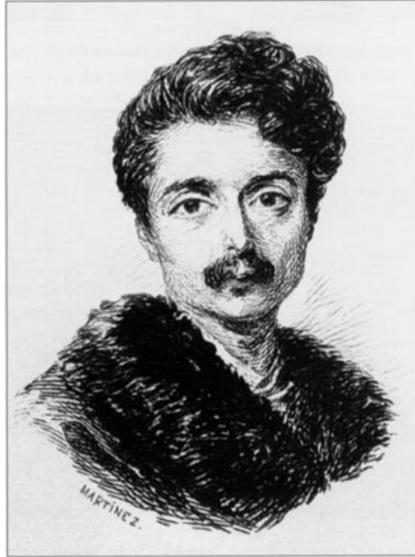
L'auteur à 20 ans.