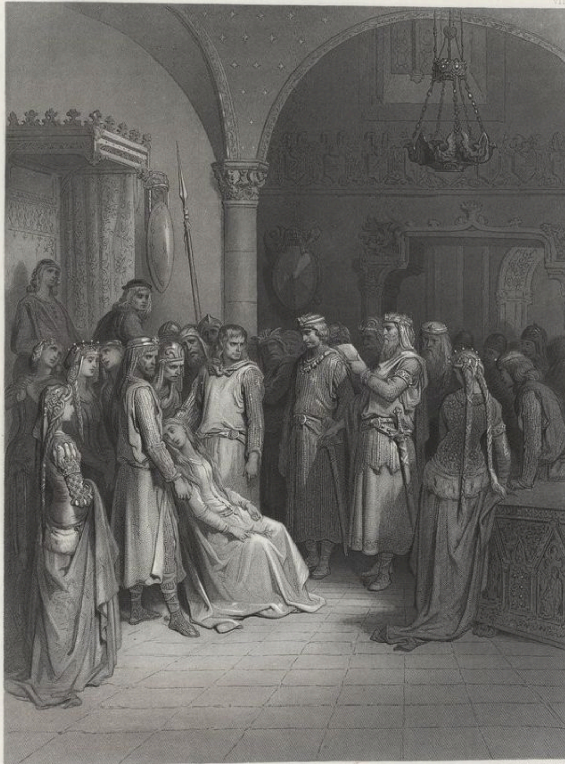
Drawn by Gustave Doré