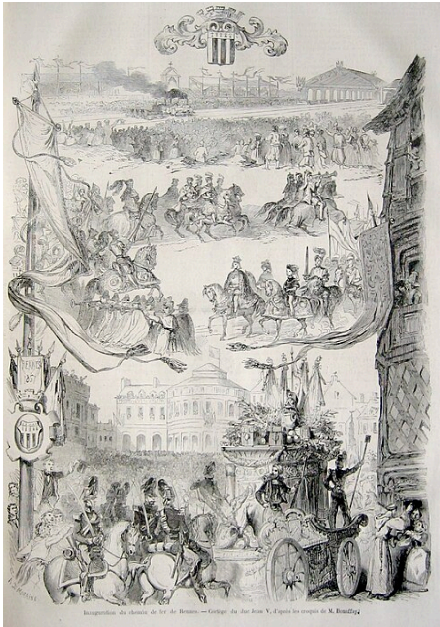
Inauguration du chemin de fer de Rennes — Cortège du duc Jean V