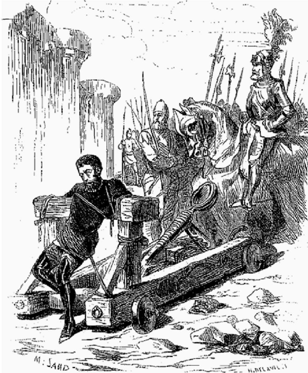
Et le fit attacher à une machine de guerre.

Nos deux écoliers wickléfistes prièrent donc Jean Huss, leur maître et leur hôte, de leur permettre d'orner de quelques fresques le vestibule de sa maison. «Ce qu'ayant obtenu, ils représentèrent, d'un côté, Jésus-Christ entrant à Jérusalem sur une ânesse, suivi de la populace à pied; et, de l'autre, le pape monté superbement sur un beau cheval caparaçonné, précédé de gens de guerre bien armez, de timbaliers, de tambours, de joueurs d'instruments,