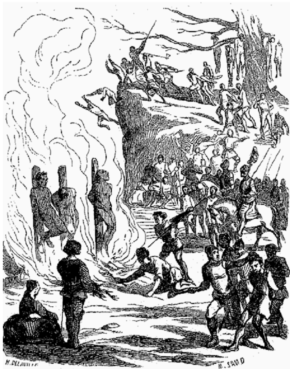
Et firent brûler leur commandant...

Pendant ce temps, les Taborites et les Orébites marchaient à la rencontre de l'Empereur, qui entrait en Bohême par Cultemberg. Malgré la clémence de Ziska, les mineurs revenaient à Sigismond, et, commandés par le brigand Miesteczki, celui qui avait pillé les moines d'Opatowitz pour son compte et qui ensuite s'était uni à Ziska, ils reprirent Przelautzi, jetèrent cent-vingt-