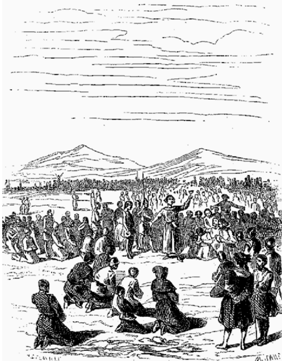
Il s'attroupe une grande multitude.

Ces docteurs bohémiens avaient tenté surtout de rétablir les coutumes de l'Église grecque, auxquelles la Bohême, convertie primitivement au christianisme par des missionnaires orientaux, avait toujours été singulièrement attachée. La communion sous les deux espèces et l'office divin récité dans la langue du pays, étaient surtout les cérémonies qui lui paraissaient constituer sa nationalité, représenter ses franchises et préserver