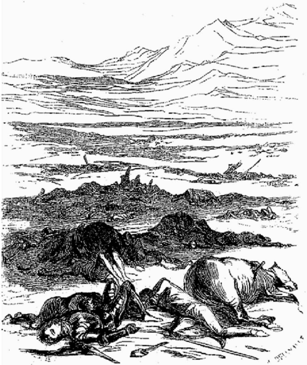
La plus grande partie de la noblesse de Moravie y demeura.

proclamations religieuses et dans les émeutes. Ils faisaient pendant aux boucliers des séditions de Paris à la même époque, et je pense que l'appellation de cordonnier était devenue synonyme, en Bohême, de celle de sans-culotte dans notre révolution.