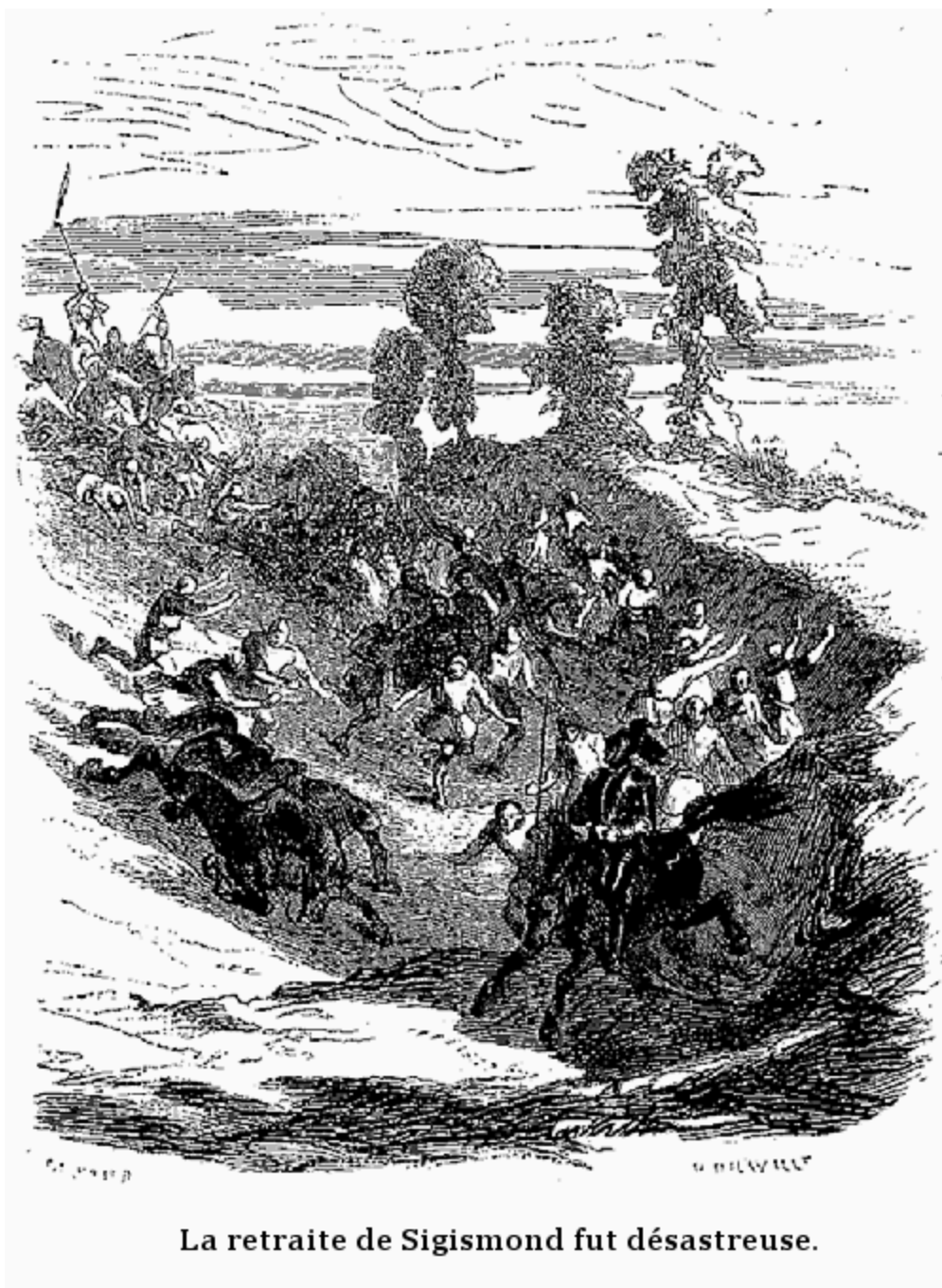
La retraite de Sigismond fut désastreuse.

10. «Dans ce temps-là, les femmes engendreront par l'amour sans que les sens y aient part, et elles enfanteront sans douleur.»