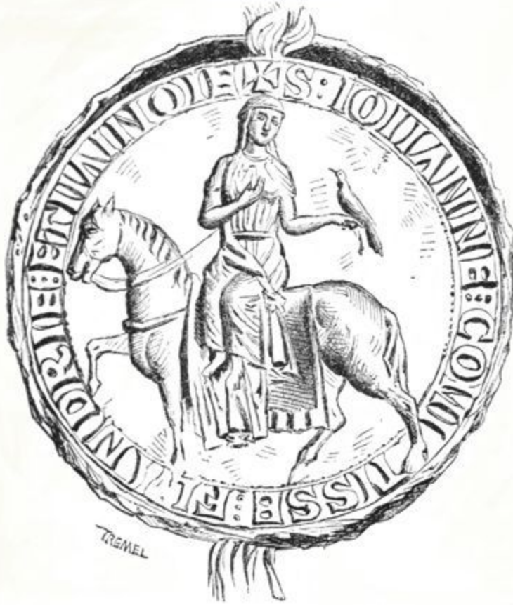
Sceau de la Comtesse Jeanne.