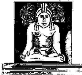
Figure d'un des 8 Bouddhas, sous une tête d'Homme typhonien ou de Siva, trouvée à Uxmal en Yucatan.

Homme du Royaume du Fou-Sang, qui traite une Biche tachetée comme on en a trouvé en Amérique.