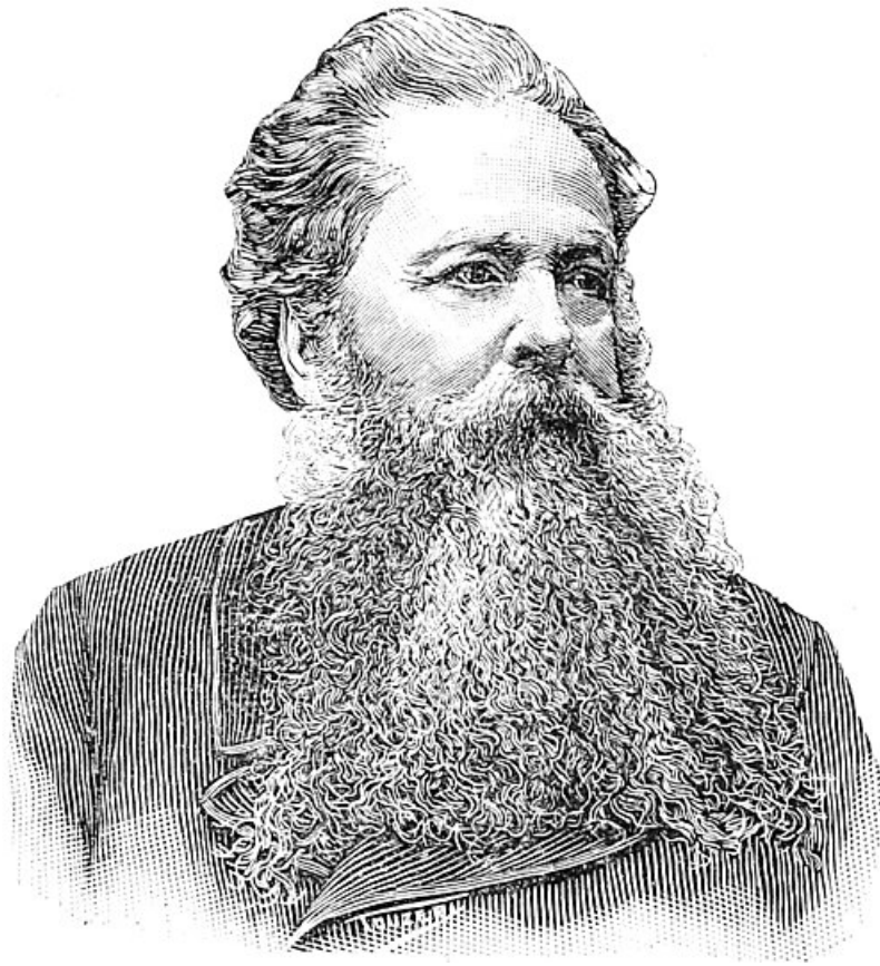
EUGÈNE LE ROY 1836-1907