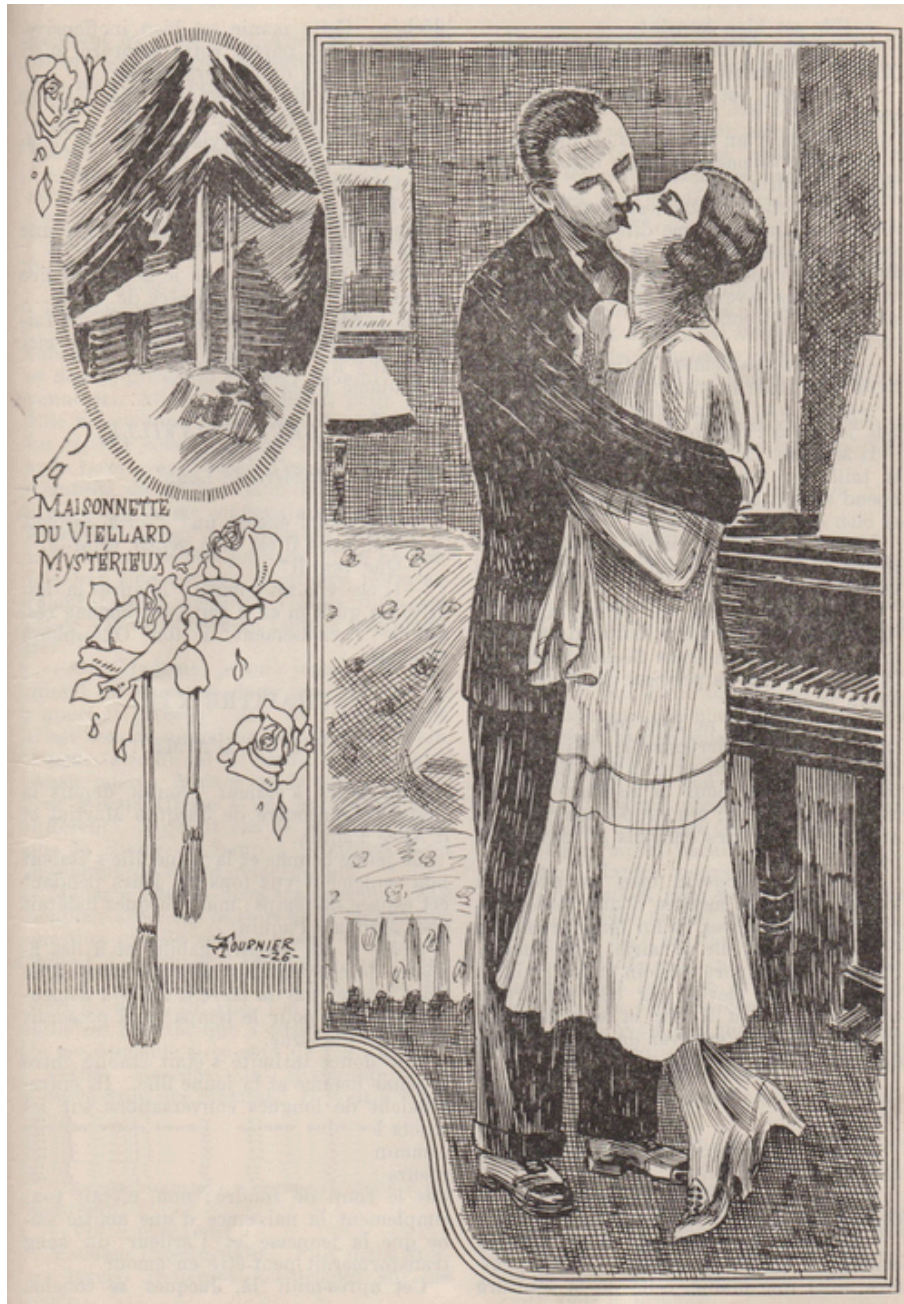
Puis il s'approcha d'elle et la baisa sur les lèvres...