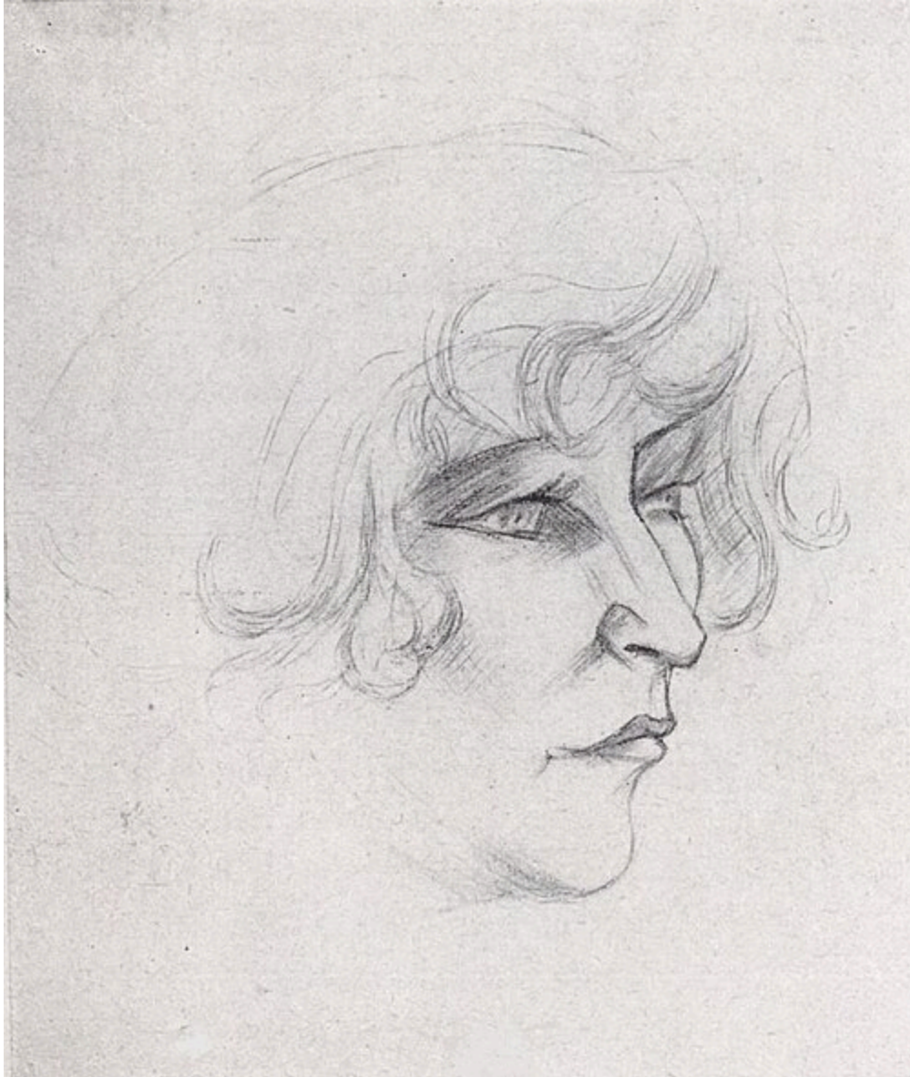
Portrait de Colette par André Favory