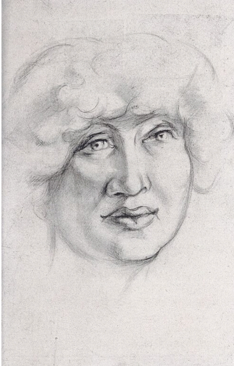
Portrait de Séverine par André Favory

Ses mains nues, rapprochées de son cœur, abritaient une flamme mystérieuse qui, tout à coup, s'envola : Elle parla ! Sa parole courut comme une flamme de passion sur nous tous. Quel prodige ! Cette foule remuante est suspendue à ses lèvres. Avec une éloquence sublime elle dit ce que fut Rodin et quelle œuvre il laisse derrière lui. Emportée par son inspiration, elle s'élève et plane, opposant, en une image admirable, cette jeunesse immortalisée dans le marbre et la jeunesse décimée par la guerre. Ce qu'elle