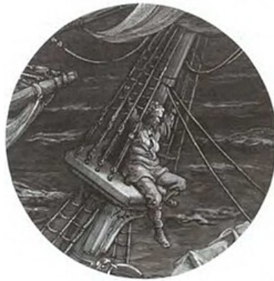
Illustration de Gustave Doré

Il s'en alla comme un homme étourdi et qui a perdu le sens. Le lendemain matin, il se leva plus triste, mais plus sage.