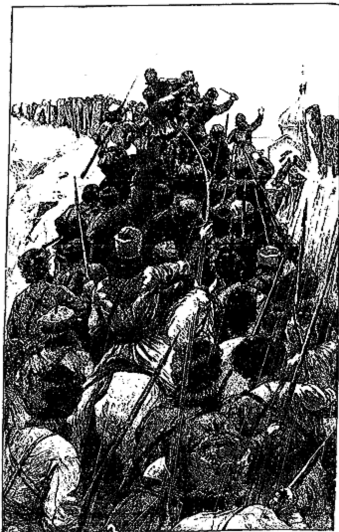
LES REBELLES SE RUÈRENT SUR NOUS.

On nous traîna le long des rues. Les habitants sortaient de leurs maisons, offrant le pain et le sel. On sonna les cloches. Tout à coup des cris annoncèrent que le tsar était sur la place, attendant les prisonniers pour recevoir leurs serments. Toute la foule se jeta de ce côté, et nos gardiens nous y traînèrent.