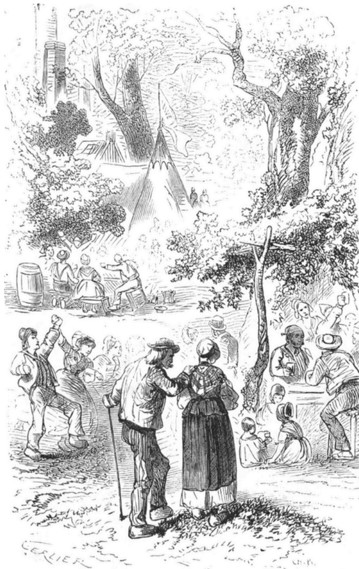
Le jour de la fête, il fit un temps magnifique.

Le jour de la fête, il fit un temps magnifique ; on était à la fin de mai. Avant l'arrivée des invités pour l'expérience des toiles cuivre et zinc, tous les ouvriers et fournisseurs des usines se rassemblèrent dans la grande prairie devant les ateliers. Un coup de canon annonça l'arrivée de M. Féréor accompagné de Gaspard. La voiture s'arrêta au milieu de la prairie. M. Féréor descendit lestement, malgré ses soixante-dix ans ; Gaspard se plaça à sa droite. Les cris et les vivats des ouvriers furent arrêtés par un signe de M. Féréor, qui annonça qu'il voulait parler.