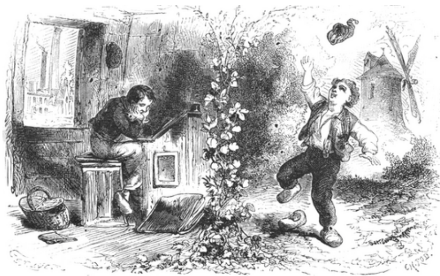
Lucas reprit sa gaieté ; Gaspard resta sérieux.

La paix fut ainsi conclue, et Thomas, se sentant pardonné par sa femme et ses enfants, perdit son air bourru, reprit sa bonne humeur, but moins de cidre, n'entra plus si souvent en colère à propos de rien, rendit un peu de calme à toute la ferme, et ne se vit plus toujours entouré de visages craintifs, tristes et mécontents. Lucas reprit sa gaieté ; Gaspard resta sérieux, car il l'était par nature, mais il perdit une partie de la crainte que lui inspirait son père.