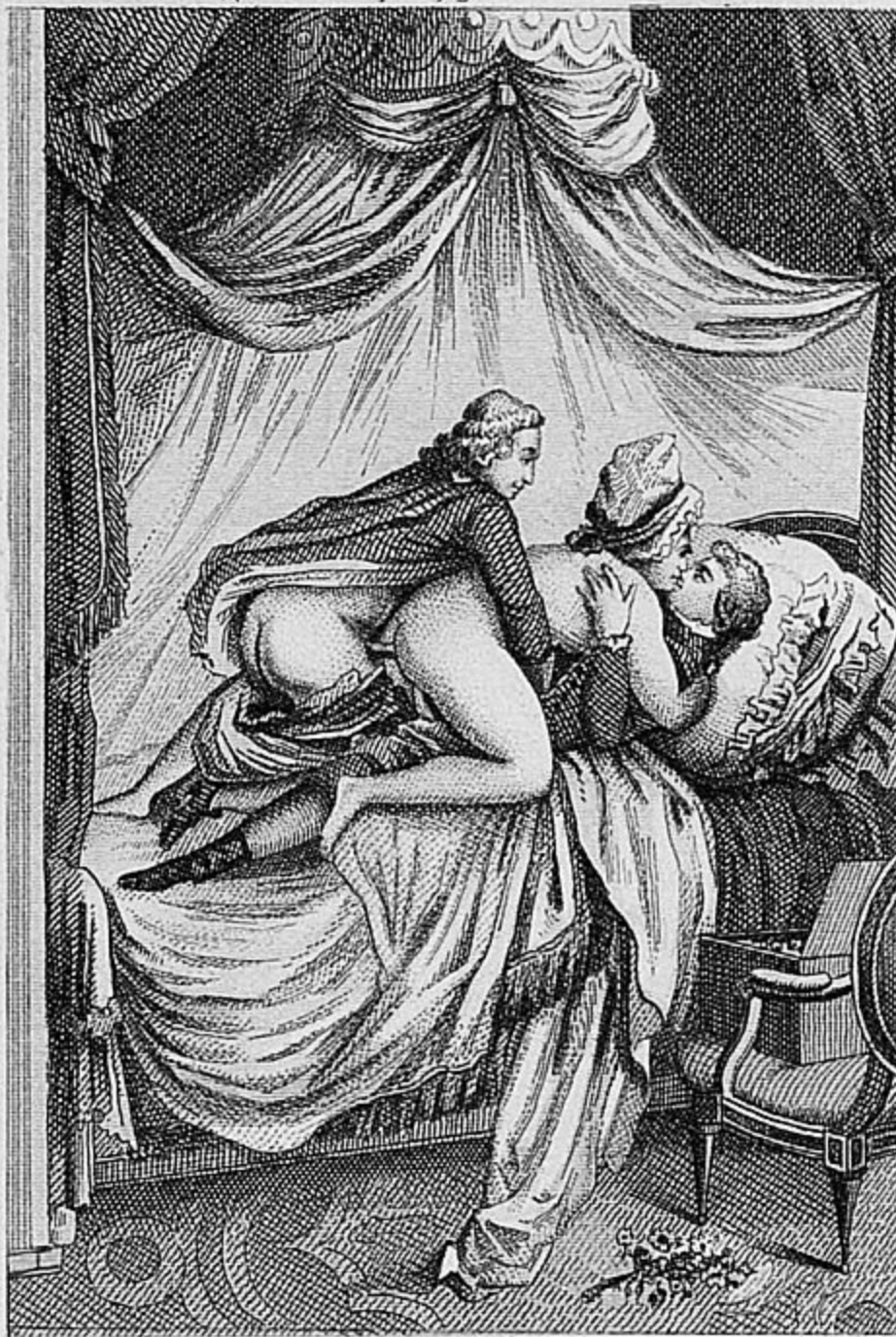
Le Doctorat impromptu figure page 93

« Ce fut probablement à travers cette tempête de sensations extrêmes que Cudard fut heureux à sa manière. Solange aussi fut assez heureux pour ne plus songer à la honte d'un partage. Mais que les degrés de ravissement