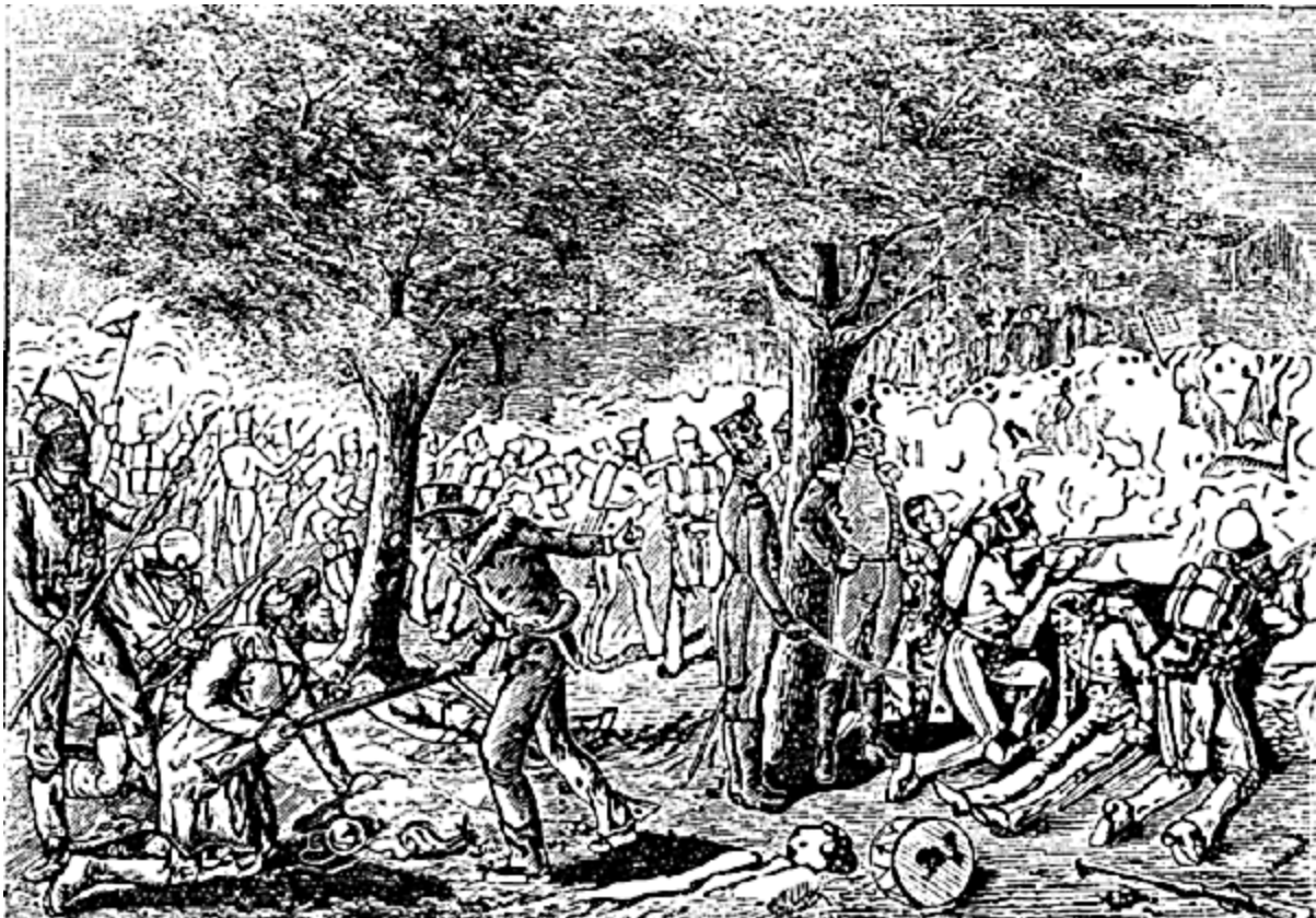
LA BATAILLE DE CHATEAUGUAY