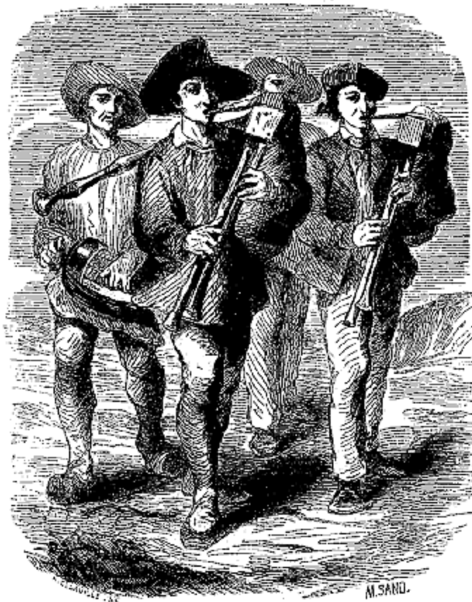
Les cornemuseux arrivent en jouant.

La premier mouvement de Henri fut de profiter de ce qui pouvait n'être qu'un moment de répit pour s'éloigner davantage et faire perdre entièrement ses traces. Mais ce cri affreux lui laissait une impression trop pénible. Était-ce bien cette femme qui l'avait fait entendre? Le son n'avait presque rien d'humain, et cependant quelle douleur, quel désespoir atroce il semblait exprimer! Se serait-elle grièvement blessée en tombant? pensa Lémor; ou bien, en me perdant de vue derrière ces saules, a-t-elle cru que je m'étais noyé? Est-ce un cri d'agonie ou de terreur? Ou bien est-ce la rage de n'avoir pu me suivre jusque dans l'eau, où elle peut présumer que je me suis jeté?