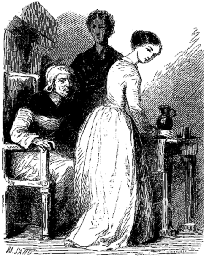
Le groupe qui se présentait consistait de trois générations.