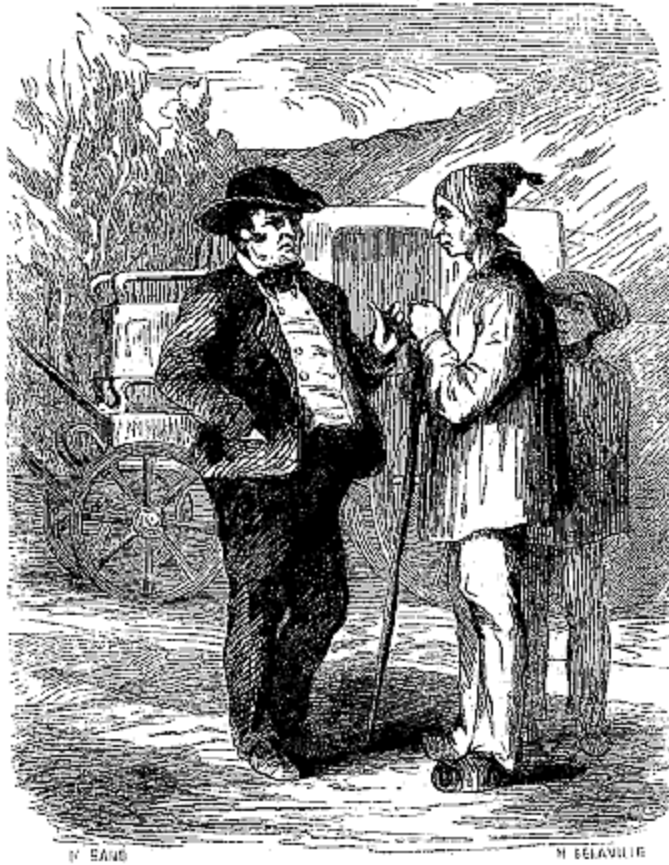
Là-dessus, M. Bricolin de dénigrer le carosse.

—Oui, oui, ça m'afflige et ça me fâche, dit la mère Bricolin avec son ton franc et bref, qui cachait cependant une grande douceur et une grande bonté (et c'est en cela que Rose lui ressemblait, ayant le parler vif et l'âme tendre). Ça me saigne l'âme , continua la vieille, de voir maltraiter en paroles un honnête garçon que j'aime quasiment comme un de mes enfants, d'autant plus que je suis amie depuis plus de soixante ans avec sa mère et avec toute sa famille... Une famille de braves gens, oui! et à qui Grand-Louis n'est pas fait pour porter déshonneur!