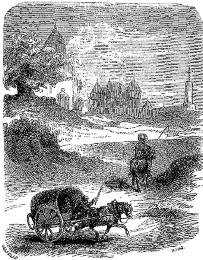
Mais le seul aspect de Blanchemont...

—Allons, Louis, je crois que tu es fou, dit la vieille Marie qui tricotait d'un air grave en écoutant toute cette conversation. Je ne sais pas où tu prends tout ce que tu dis à notre dame. Excusez, Madame, ce garçon est un sans-souci qui a toujours dit à tout le monde, petits et grands, tout ce qui lui passait par la tête. Il ne faut pas que cela vous fâche. Au fond, il a bon coeur, croyez-moi, et je vois bien à sa mine qu'il se jetterait dans le feu pour vous à cette heure.