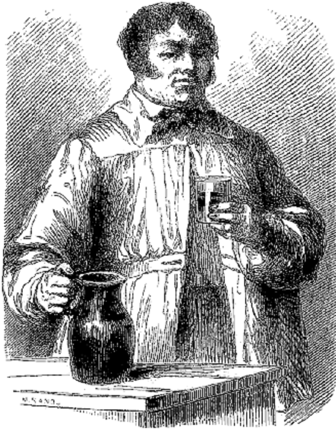
M. Bricolin était un homme de cinquante ans.

—C'est donc bien surprenant, lui dit-elle, de voir une personne qui perd sa fortune sans perdre l'esprit. D'ailleurs, ne me reste-il pas de quoi vivre?