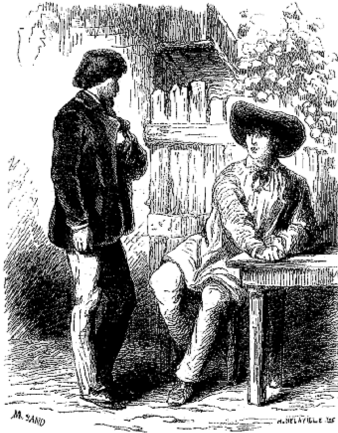
Ce garçon-là est entêté comme tous les diables.

il était loin de s'attendre au bonheur d'en recevoir immédiatement un second, lorsque Grand-Louis passa facétieusement ce trésor entre ses yeux et celui qu'il était en train de relire pour la troisième fois.