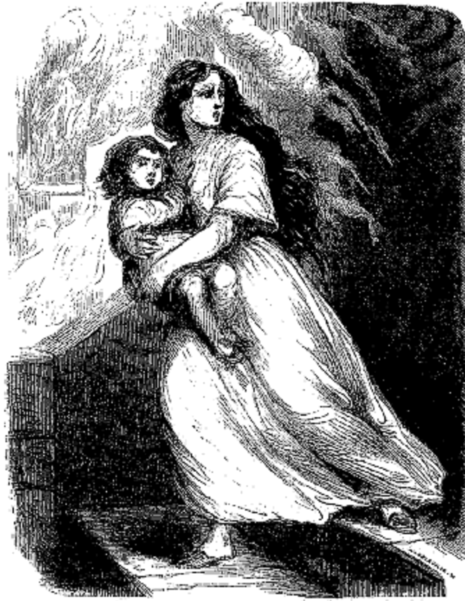
Elle s'élança dehors portant son fils dans ses bras.

Lémor approcha la lanterne. La face du mendiant était livide, ses vêtements étaient trop délabrés pour qu'une déchirure et une souillure de plus ou de moins pussent servir d'indice, mais en écartant les haillons qui lui couvraient la poitrine, on vit sur ses côtes décharnées des traces d'un rouge ardent; c'étaient les bandes de fer des roues qui l'avaient sillonné. Cependant le sang n'avait pas jailli, les côtes ne paraissaient pas brisées, et la respiration était encore assez libre. Il put même raconter son accident, et il eut assez de force pour vomir contre le riche en voiture et le vil mercenaire qui renchérisait sur l'insolence et la cruauté du maître, toutes les imprécations et tous les serments de vengeance que la rage et le désespoir purent lui suggérer.