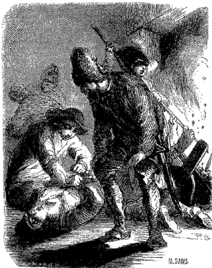
C'était vilain... ce patient qui hurlait.

—Oh! n'ayez pas peur! il a souvent passé par cette mort là; ça le connaît. Il porte pourtant bien la boisson, le compère! mais un jour de fête on en prend plus que de raison, et il n'y a, comme on dit en parlant du vin, si fidèle ami qui ne vienne à vous trahir. Allons, laissons-le au pied de cet arbre; nous le reprendrons en passant pour le conduire à la maison.