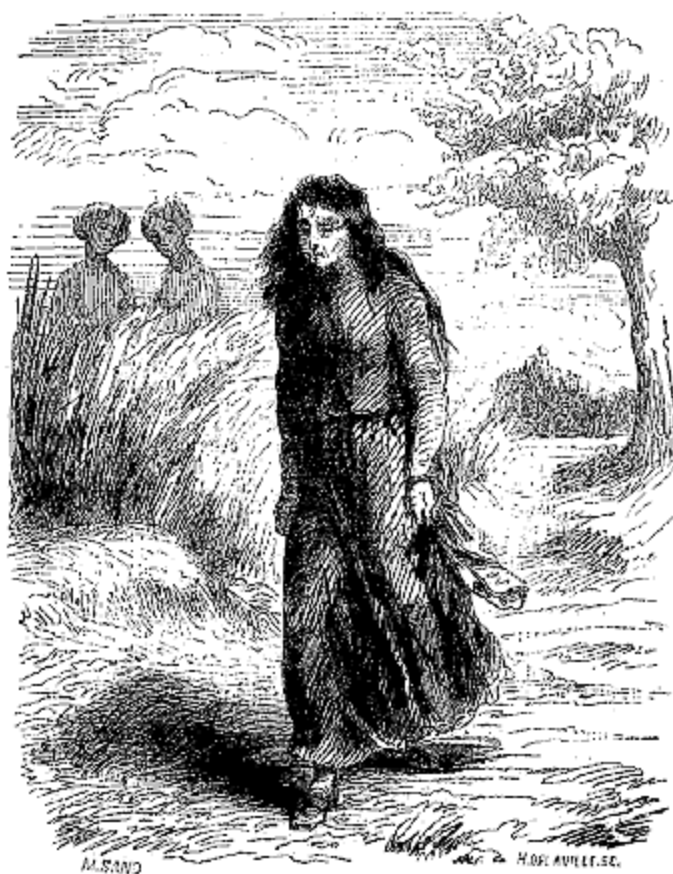
C'est la pauvre Bricoline , dit Rose.

travail excessif, et probablement la mort d'un être délicat issu d'une race d'oisifs, héritier d'une organisation chétive, et, sous ce rapport, très-inférieure à celle du paysan. Vous voyez donc qu'avec nos bonnes intentions, nous autres qui ne savons pas comment la société pourrait apporter remède à de telles alternatives, nous ne pouvons rien, sinon préférer pour nous-mêmes la médiocrité à la richesse et le travail à l'oisiveté. C'est un pas vers la vertu, mais quel pauvre mérite nous avons là, et combien peu il apporte remède aux misères sans nombre qui frappent nos yeux et consistent notre coeur!