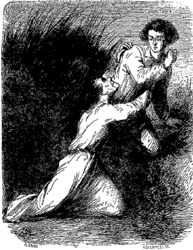
En se voyant saisi par cet être...

Mais elle s'élança sur ses traces, aussi agile dans les sillons hérissés d'une paille fraîchement moissonnée, raide et blessante, qu'elle l'avait été dans le fourré du parc. Au bout du champ, Lémor franchit une nouvelle clôture et se trouva dans un chemin couvert qui descendait rapidement. Il n'y avait pas fait dix pas qu'il entendit derrière lui le spectre criant toujours d'une voix étouffée: Paul! Paul! pourquoi t'en vas-tu?