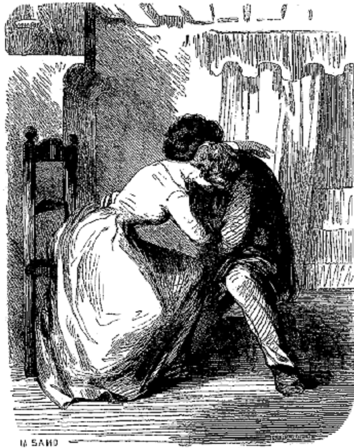
Aimons-nous, s'écria Marcelle.

La folle dort toute la journée. Elle avait la fièvre; mais depuis douze ans elle ne l'avait point quittée un seul jour, et cet anéantissement, où on ne l'avait jamais vue, faisait croire à une crise favorable. Le médecin qu'on avait appelé de la ville et qui était habitué à la voir, ne la trouva pas malade relativement à son état ordinaire. Rose, bien rassurée, et rendue aux doux instincts de la jeunesse, s'habilla lentement avec beaucoup de coquetterie. Elle voulait être simple pour ne pas effaroucher son ami, en faisant devant lui l'étalage de sa richesse; elle voulait être jolie pour lui plaire. Elle chercha donc les plus ingénieuses combinaisons, et réussit à être modeste comme une fille des champs et belle comme un ange du paradis. Sans vouloir s'en rendre compte, au milieu de toutes ses douleurs, elle avait un peu tremblé à l'idée de perdre cette riante journée. A dix-huit ans, on ne renonce pas sans regret à enivrer tout un jour l'homme dont on est aimée, et cette crainte était venue, à l'insu d'elle-même, se mêler à la sincère et profonde douleur que sa