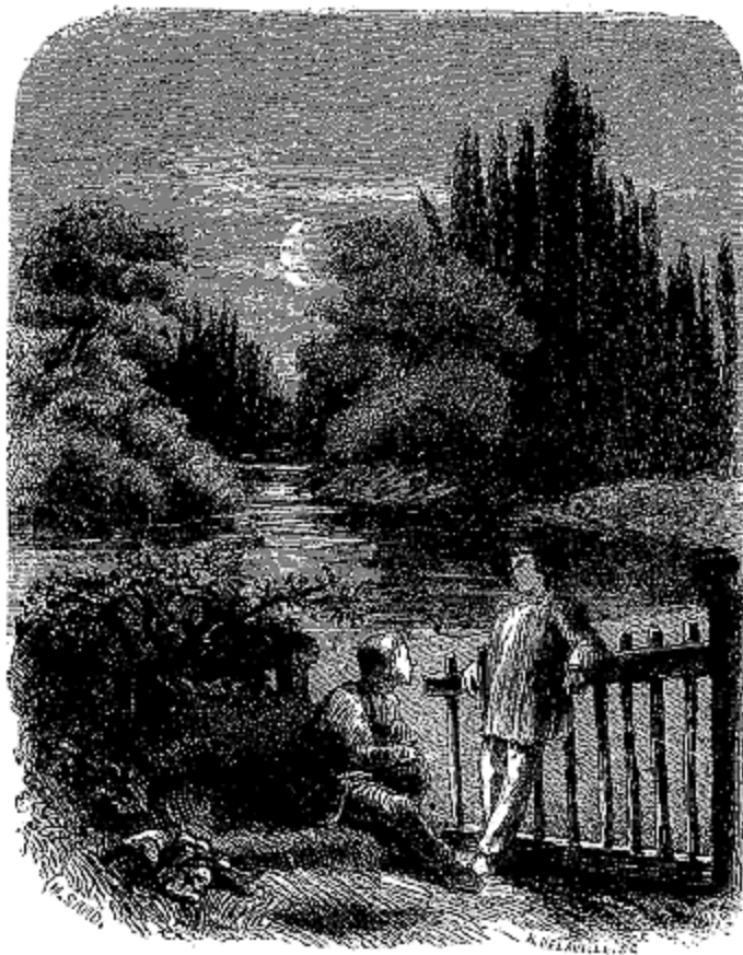
Tenez, ajouta-t-il lorsqu'ils furent au pied de l'arbre.

—Comment pouvez-vous me soupçonner encore quand je reviens dans votre Vallée-Noire, seulement pour respirer l'air qu'elle a respiré, lorsque je sais enfin qu'elle est pauvre?