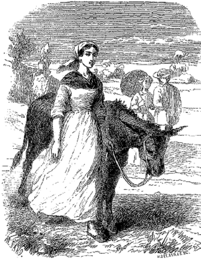
Une paysanne pour conduire son âne.

—Comme de la justice et de la bonté de Dieu.