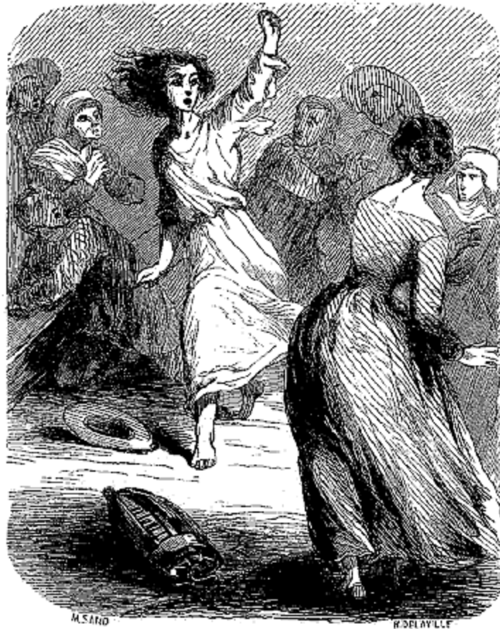
Se jeta au milieu de la bourrée en criant malheur.

«Demain je vous écrirai des détails, aujourd'hui je suis sous le coup de la découverte d'un nouvel abîme. Je vous l'annonce en peu de mots. Je sais que vous pouvez tout comprendre et tout supporter. Adieu, ma fille, je vous admire et je vous aime.»