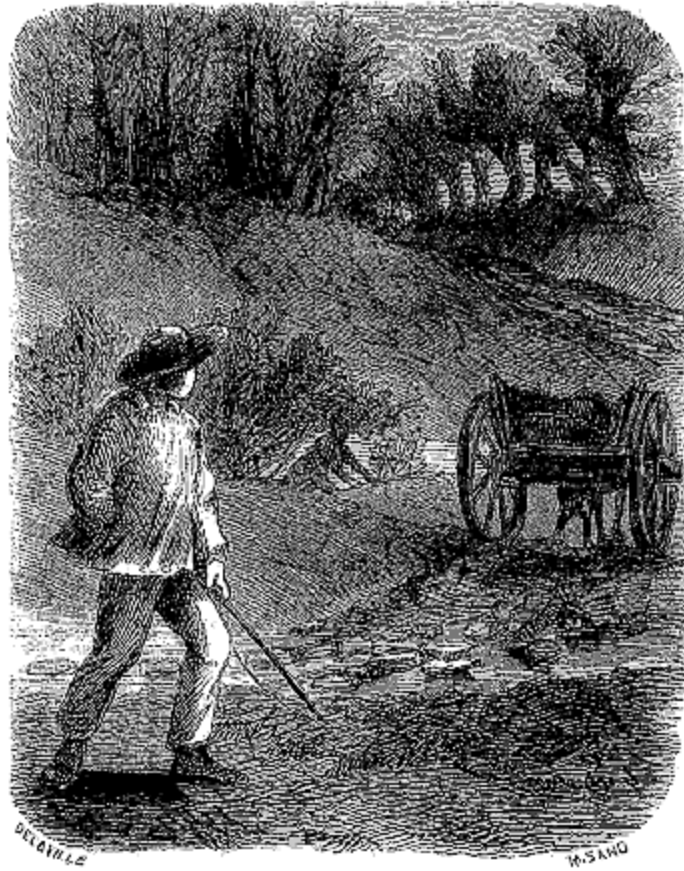
Il lui sembla voir une forme vague.

—Diable! se disait le meunier, ouvrier mécanicien! aimé d'une baronne! cherchant de l'ouvrage et pouvant peut-être épouser une femme qui a encore trois cent mille francs! Ce n'est donc que chez nous qu'on préfère l'argent à l'amour, et que les femmes sont si fières! Il n'y a pas tant de distance entre la petite-fille du père Bricolin le laboureur et le petit-fils de mon grand-père le meunier, qu'entre cette baronne et ce pauvre diable! Ah! mademoiselle Rose! je voudrais bien que madame Marcelle vous apprit le secret d'aimer! Puis, faisant lui-même le signalement du jeune homme sans regarder celui du passe-port, Grand-Louis se disait en examinant Henri absorbé dans sa lecture: Taille médiocre, visage pâle... assez joli, si l'on veut, mais cette barbe noire, c'est vilain. Tous ces ouvriers de Paris ont l'air de porter toute leur force au menton. Et le meunier comparait avec une secrète complaisance ses membres athlétiques à l'organisation plus délicate de Lémor. Il me semble, se disait-il, que s'il ne faut pas être plus remarquable