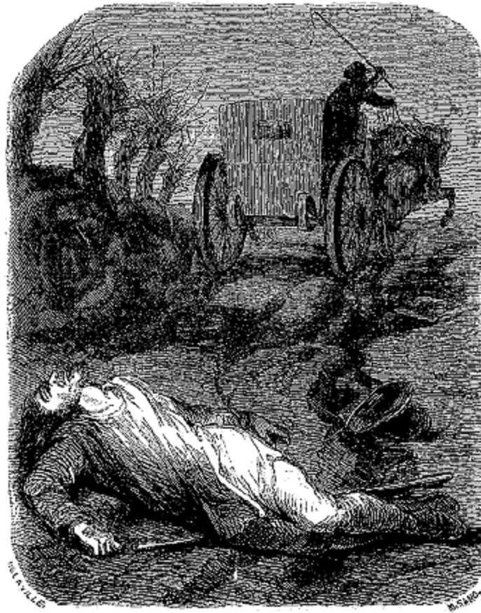
Le chemin était sombre et désert.

—Écoutez! mon père, dit-elle en saisissant avec force le bras de M. Bricolin; écoutez bien, et osez donc rire encore de la folie des jeunes filles! Plaisantez sur les maisons des fous, vous qui semblez oublier qu'une fille de notre rang peut aimer un homme sans fortune, jusqu'à tomber dans un état pire que la mort!