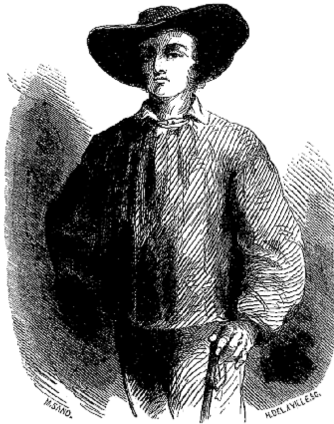
L'échantillon du terroir qui se présentait...

Mais notre voyageuse eut bientôt perdu de vue ce magnifique panorama. Une fois engagée dans les versants de la Vallée-Noire, on change de spectacle. Descendant et gravissant tour à tour des chemins encaissés de buissons élevés, on ne côtoie point de précipices, mais ces chemins sont des précipices eux-mêmes. Le soleil, en s'abaissant derrière les arbres, leur donne une physionomie particulière étrangement gracieuse et sauvage. Ce sont des fuyants mystérieux sous d'épais ombrages, des traînes d'un vert d'émeraude qui conduisent à des impasses ou à des mares stagnantes, des tournants rapides qu'on ne peut plus remonter quand on les a descendus en voiture, enfin, un enchantement continu pour l'imagination, avec des dangers très-réels pour ceux qui vont, à l'aventure, essayer, autrement qu'à pied, et tout au plus à cheval, ces détours séduisants, capricieux et perfides.