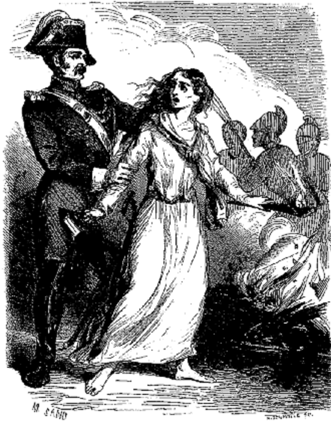
Le gendarme l'arrêta en la prenant par le bras.

Arrivés au bas du terrier, comme ce pauvre animal, haletant et couvert d'écume, ne pouvait plus gravir le chemin qu'au pas, ils l'arrêtèrent devant chez la Piaulette, et sautèrent du cabriolet pour courir plus vite. En ce moment, Marcelle, sortant de la chaumière, parut à leurs yeux. Elle était pâle, mais calme, et ses vêtements ne portaient la trace d'aucune brûlure. Occupée toute la nuit à soigner les personnes, elle ne s'était pas consacrée inutilement à vouloir éteindre le feu. En la voyant, Lémor faillit s'évanouir de joie; il lui prit la main sans pouvoir lui parler.