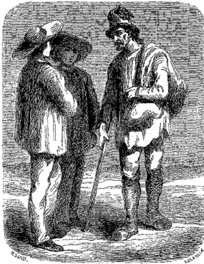
Le mendiant toisait d'un air dédaigneux Lemor.

Et le Grand-Louis gravit un peu la côte de Condé d'où l'on découvrait les tours de Blanchemont et à peu près tout le chemin qui y mène. Quand il se fut assuré que les deux amazones ne paraissaient pas encore, il retourna auprès de son prisonnier.