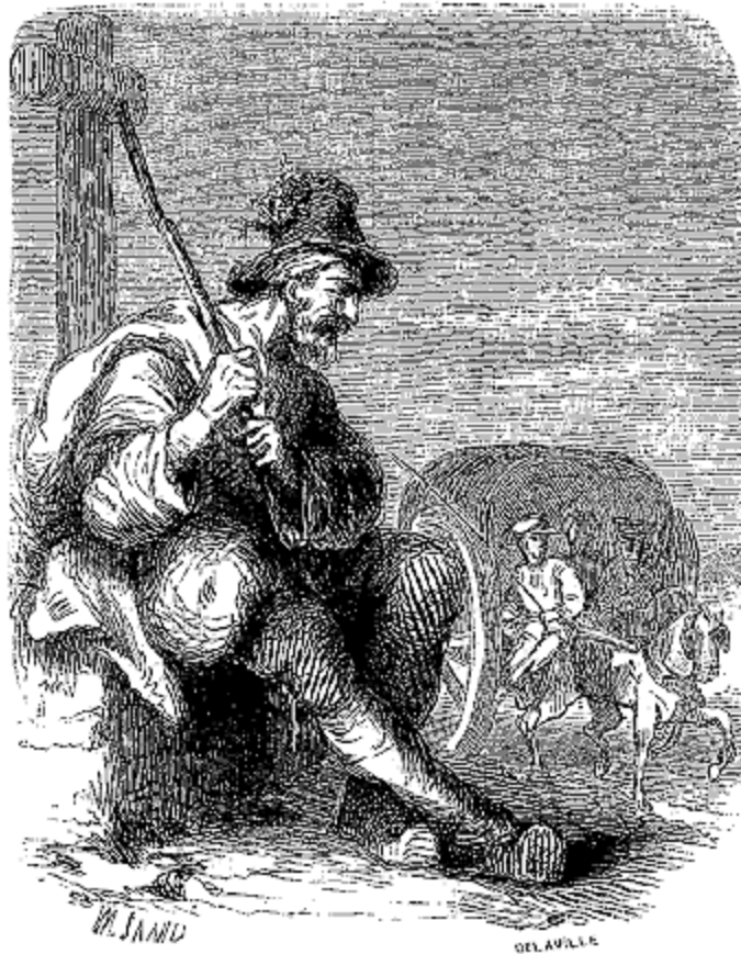
Nos voyageurs embarrassés s'adressèrent à un mendiant.

Plus d'une fois, voyant le chemin rapide, mais sec, Marcelle et ses gens avaient mis pied à terre; mais on ne pouvait marcher cinq minutes sans arriver à un de ces fonds où le chemin se resserre et se trouve entièrement occupé par une source à fleur de terre, sans écoulement, et formant une mare liquide impossible à franchir à pied pour une femme délicate. La Parisienne Suzette aimait mieux verser, disait-elle, que de laisser sa chaussure dans ces bourbiers, et Lapierre, qui avait passé sa vie en escarpins sur des parquets bien luisants, était tellement gauche et démoralisé, que madame de Blanchemont n'osait plus lui laisser porter son fils.