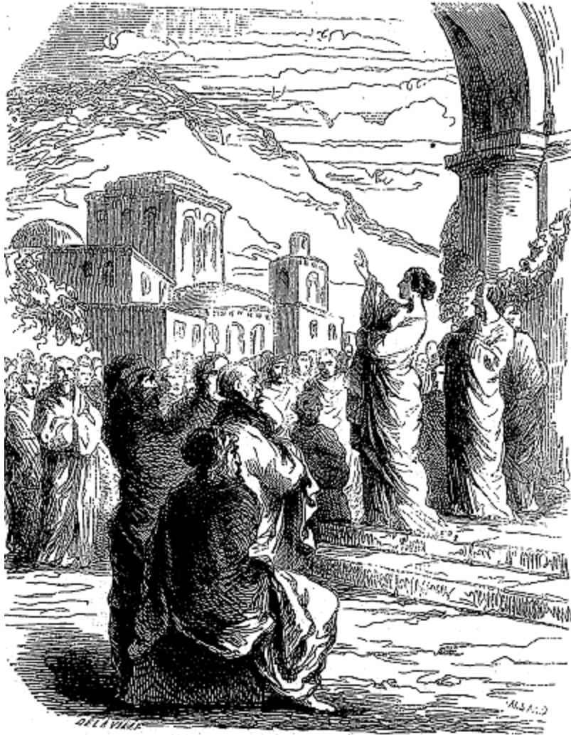
Que le peuple écoutait sur la place publique.

Enfin le feu s'ouvrit un passage à travers le roc et l'argile, et se répandit au dehors comme un fleuve débordé. La mer, brisant ses digues de la veille, fit chaque jour de nouvelles invasions, et chaque jour déserta ses nouveaux rivages comme un lit trop étroit. On voyait, dans l'espace d'une nuit, s'élever des montagnes de fange ou de cendre, que le soleil et le vent façonnaient à leur gré; des ravins se creusaient tels que la vie d'un homme voyageant le jour et la nuit n'eût pas suffi pour en trouver le fond; des météores gigantesques erraient sur les eaux comme des soleils détachés de la voûte céleste, et les vagues de l'océan roulaient sur les sommets que les nuages enveloppent aujourd'hui bien loin au-dessus de la demeure des hommes.