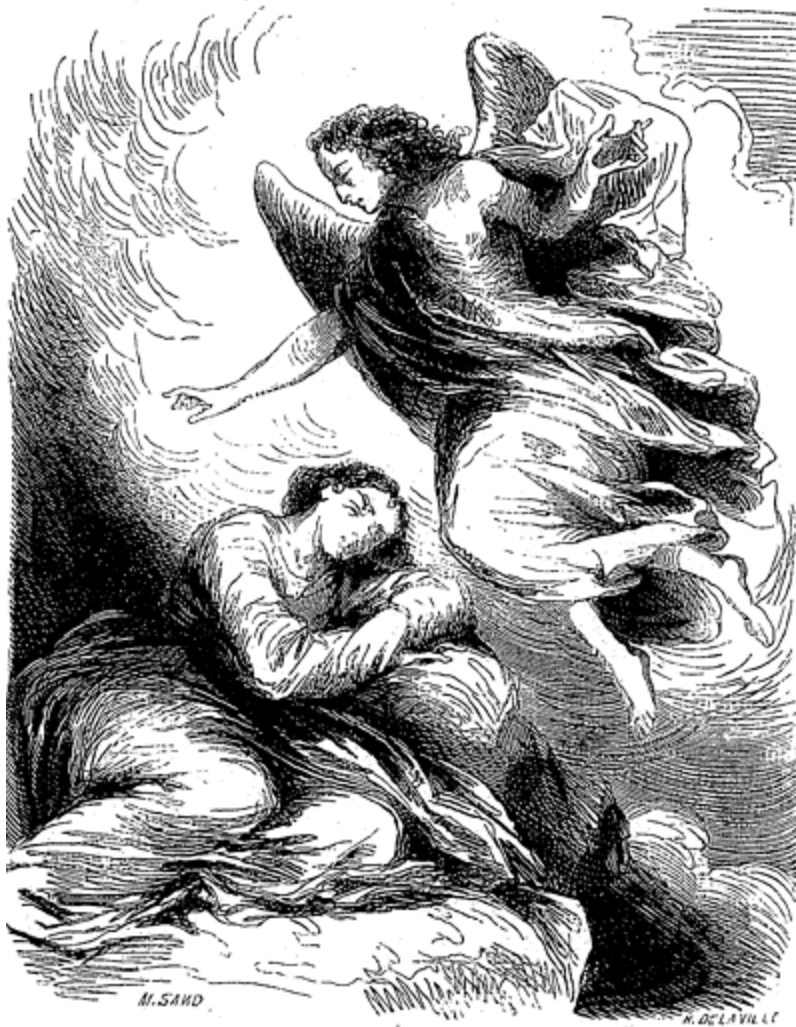
L'ange du sommeil l'appela.

Ces volcans, ces déluges, ces cataclysmes, cet ouvrage informe du temps et de la matière, les saintes Écritures l'appellent l'âge du chaos. Or, tandis que les quatre Esprits se livraient à la guerre, il arriva qu'ils passèrent près du char de Dieu, et, frappés de terreur, ils s'arrêtèrent. Dieu les appela et leur dit: Qu'avez-vous fait? Pourquoi ce monde que je vous ai confié marche-t-il comme s'il était ivre? Avez-vous bu la coupe de l'orgueil? Prétendez-vous faire les oeuvres de l'Éternel? Un esprit plus puissant que vous va se lever à ma voix; il vous enchaînera, et vous forcera de vivre en paix.