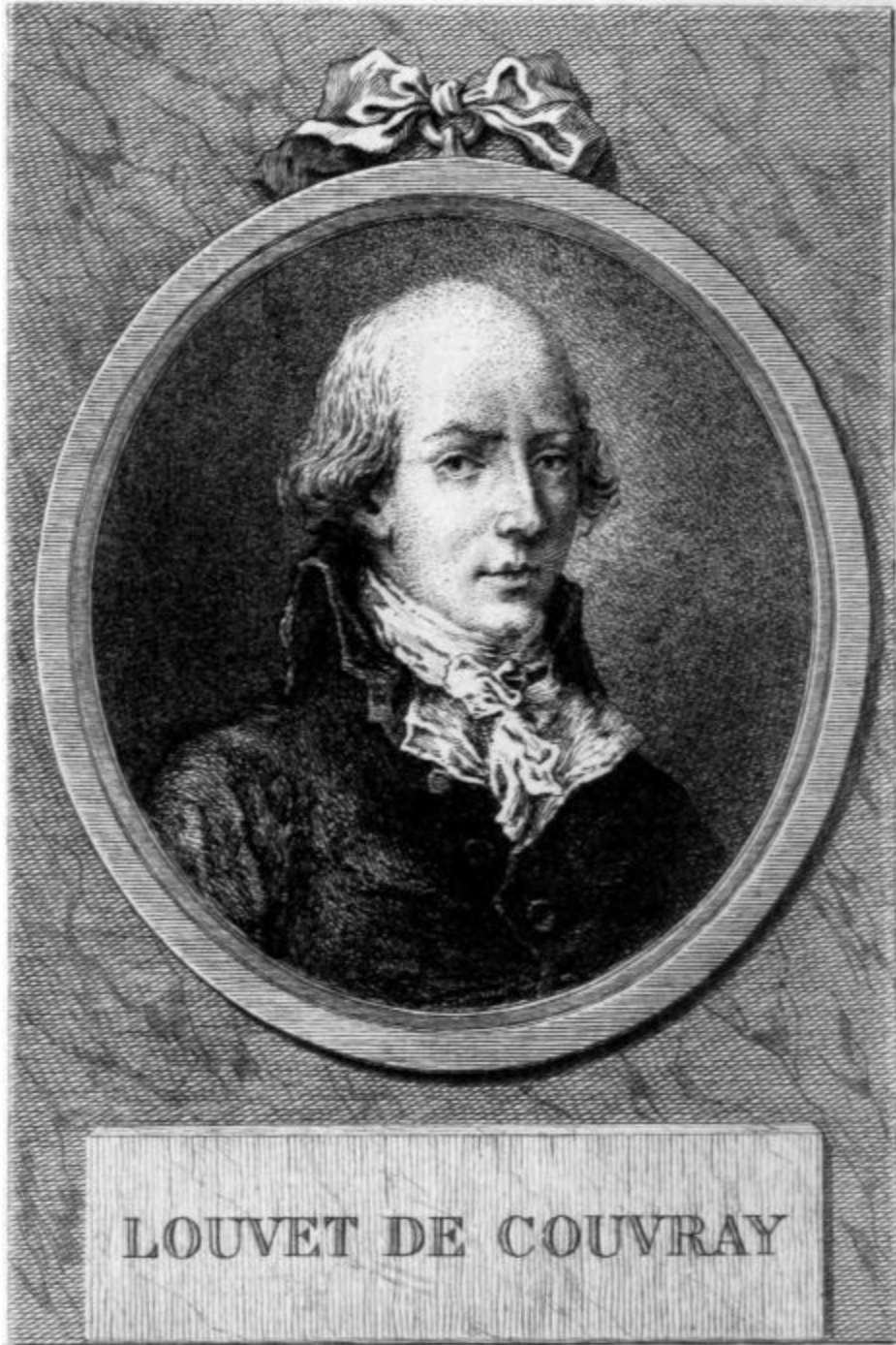
LOUVET DE COUVRAY