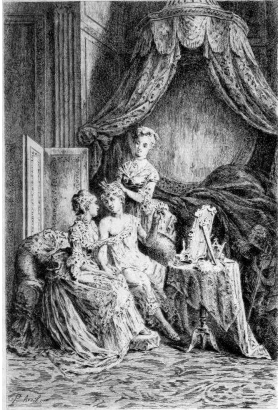
FAUBLAS HABILLÉ EN FEMME

M. Duportail ne put s'empêcher de rire avec moi de la bonne foi du marquis. «Monsieur, dit-il à celui-ci, c'est que, comme vous l'avez fort bien remarqué, mon fils et ma fille se ressemblent un peu; il faut convenir qu'il y a un air de famille.—Oui, répondit le marquis en me regardant toujours, ce jeune homme est bien, fort bien; mais sa sœur est encore mieux, beaucoup