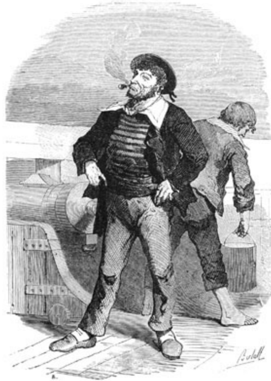
Un matelot de la Sibylle .

ta mère ni de ton avenir; vite, conduis-moi près d'elle, que je la voie, que je la console!»