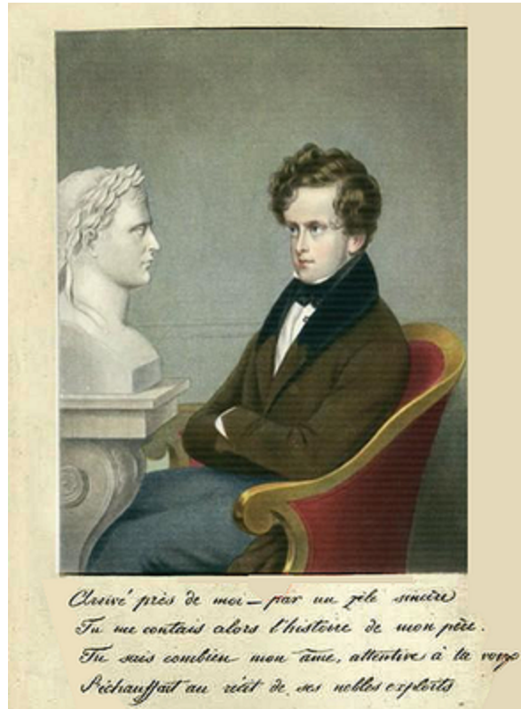
Portrait du Duc de Reichstadt.

Arrivé près de moi--par un joli sourire Tu me contais alors l'histoire de mon père Tu sais combien mon âme attentive à ta voix S'échauffait au récit de ses nobles exploits.