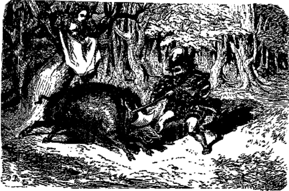
Le Sanglier fondit sur Ourson.

terre les débris des provisions que tu apportais sans doute pour notre dîner. Il est tard, le jour baisse. Si nous pouvions revenir à la ferme avant la nuit!»