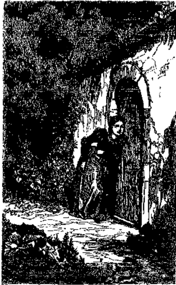
Elle colla son oreille contre la porte.

dangereuse que son père retenait captive, et elle voulut se retirer et fermer la porte.