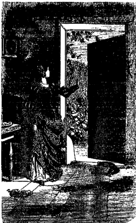
Agnella leva la tête et vit une alouette.

—Arrêtez, ma soeur», interrompit une petite voix douce et flûtée qui semblait venir d'en haut. (Agnella leva la tête et vit une Alouette perchée sur le haut de la porte d'entrée.) «Vous vous vengez trop cruellement d'une injure infligée non à votre caractère de fée, mais à la laide et sale enveloppe que vous avez choisie. Par l'effet de ma puissance, supérieure à la vôtre, je vous défends d'aggraver le mal que vous avez déjà fait et qu'il n'est pas en mon pouvoir de défaire. Et vous, pauvre mère, continua-t-elle en s'adressant à Agnella, ne désespérez pas; il y aura un remède possible à la difformité de votre enfant. Je lui accorde la facilité de changer de peau avec la personne à laquelle il aura, par sa bonté et par des services rendus, inspiré une reconnaissance et une affection assez vives pour qu'elle consente à cet échange. Il reprendra alors la beauté qu'il aurait eue si ma soeur la fée Rageuse n'était venue faire preuve de son mauvais caractère.