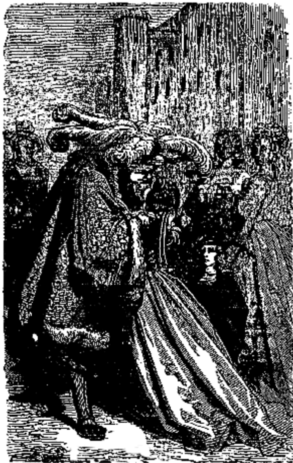
Ils restèrent longtemps embrassés.

Au même moment, Blondine se trouva dans un char de perles et d'or; à sa droite était la fée; à ses pieds était le prince Parfait, qui la regardait avec bonheur et tendresse; le char était traîné par quatre cygnes d'une blancheur éblouissante; ils volèrent avec une telle rapidité qu'il ne leur fallut que cinq minutes pour arriver au palais du roi Bénin.