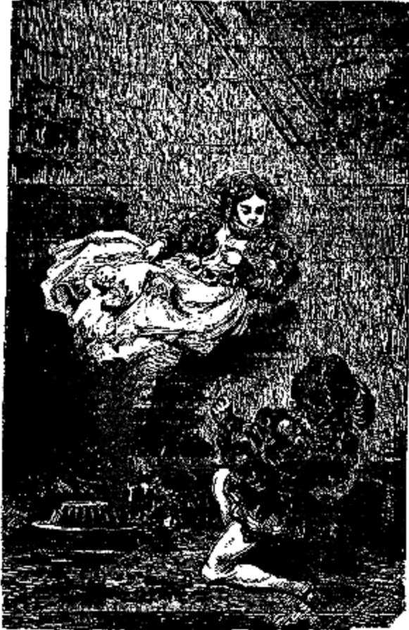
Ourson, dit la fée, je ne suis pas Violette.

«Sous peu de jours, il manquera quelque chose à ton bonheur. C'est ici que tu le trouveras. Au revoir, Ourson!