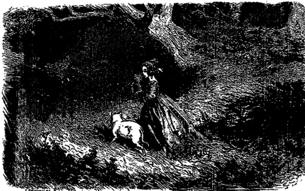
Me voici, Beau-Minon, je te suis.