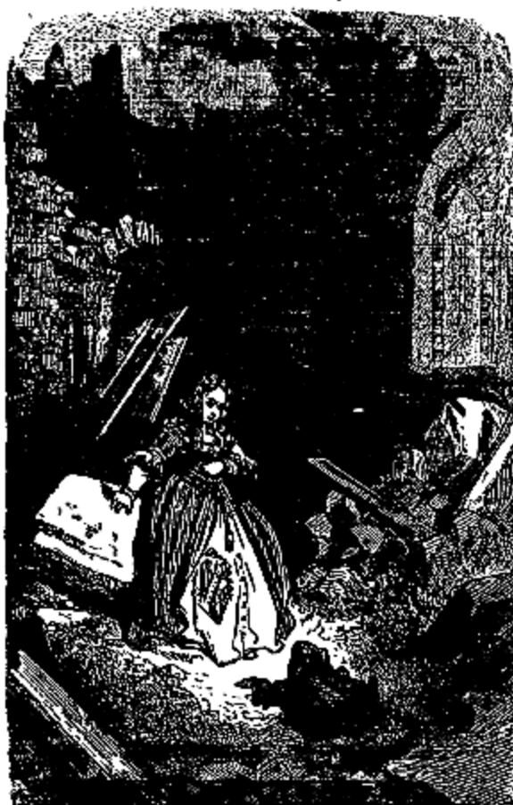
Un gros Crapaud sortit d'un tas de pierres.

«Que cherches-tu? N'as-tu pas causé, par ton ingratitude, la mort de tes amis? Va-t'en; n'insulte pas à leur mémoire par ta présence.»