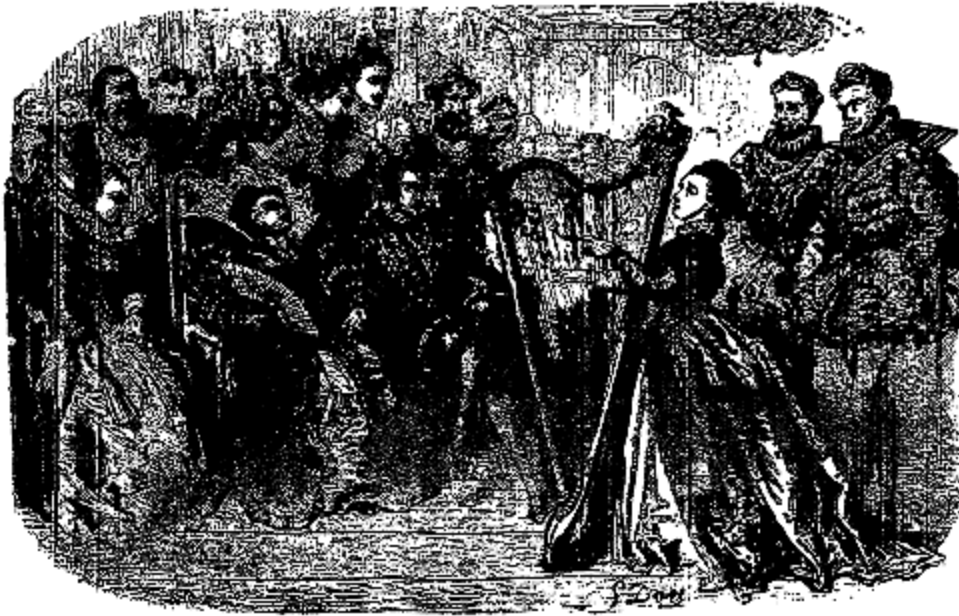
Sa voix, douce et mélodieuse, excita un enthousiasme général.

«Charmante et aimable princesse, jamais une voix plus douce n'a frappé mes oreilles; je serais heureux de vous entendre encore.»