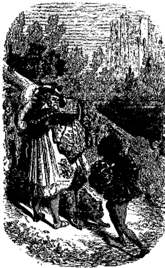
Ourson se trouva devant l'intendant.

Et il se dirigea vers une forge qui était à trois ou quatre kilomètres de la ferme des Bois. Le maître de la forge employait beaucoup d'ouvriers; il donnait de l'ouvrage à tous ceux qui lui en demandaient, non par charité, mais dans l'intérêt de sa fortune et pour se rendre nécessaire. Il était craint, mais il n'était pas aimé; il faisait la richesse du pays; on ne lui en savait pas gré, parce que lui seul en profitait, et qu'il pesait de tout le poids de son avidité et de son opulence sur les pauvres ouvriers qui ne trouvaient de travail que chez ce nouveau marquis de Carabas.