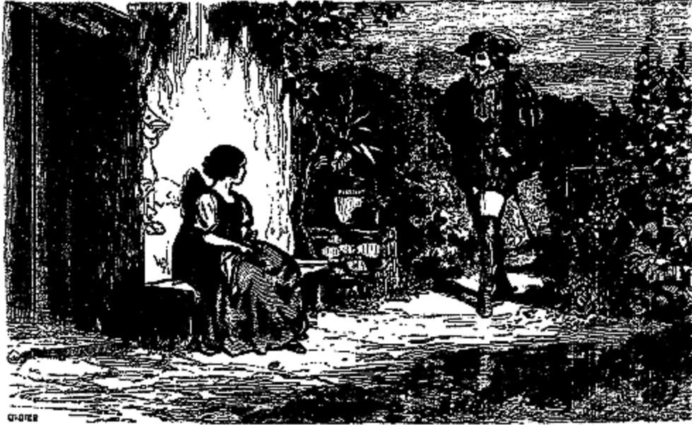
Elle vit un homme en habit et chapeau galonnés.