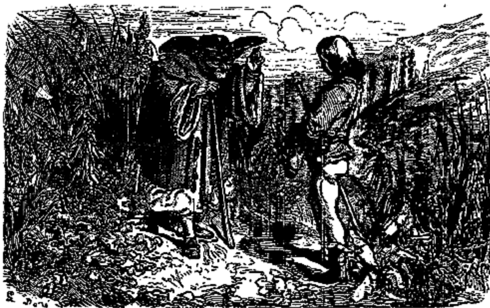
Que cherchez vous, petit?

«Voici, faites-en l'usage que vous a prescrit la fée; mais ne la laissez pas sortir de vos mains, car si vous la posez n'importe où, elle vous échappera sans que vous puissiez jamais la ravoïr.»