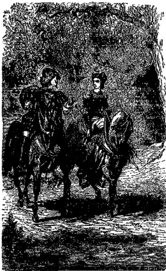
Le roi Charmant et la princesse restèrent dans les allées de la forêt.

Elle se recoiffa et se rhabilla encore avec soin, et, quand elle courut à sa glace, elle ne put retenir un cri d'admiration. Sa robe était en gaze qui semblait faite d'ailes de papillons, tant elle était fine, légère et brillante; elle était parsemée de diamants qui brillaient comme des étincelles; le bas de la robe, le corsage et la taille étaient garnis de franges de diamants éclatants comme des soleils. Sa tête était à moitié couverte d'une résille de diamants terminée par de gros glands de diamants qui tombaient jusque sur son cou; chaque diamant était gros comme une poire et valait un royaume. Son collier, ses bracelets étaient en diamants si gros et si étincelants, qu'ils faisaient mal aux yeux lorsqu'on les regardait fixement.