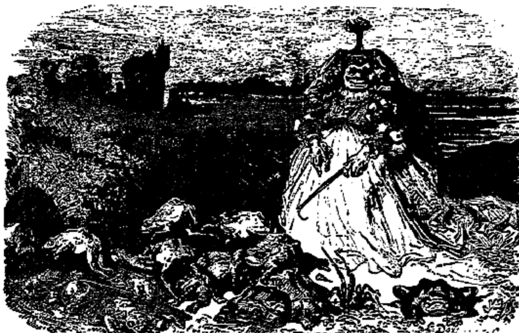
La fée Rageuse.

«Ma soeur l'a emporté sur moi, prince Merveilleux. Il me reste pourtant une consolation; tu ne seras pas heureux, parce que tu as retrouvé ta beauté première aux dépens du bonheur de cette petite sotte qui est affreuse, ridicule, et dont tu ne voudras plus approcher. Oui, oui, pleure, ma belle Oursine; tu pleureras longtemps et tu regretteras amèrement, si tu ne le regrettes déjà, d'avoir donné au prince Merveilleux ta belle peau blanche.