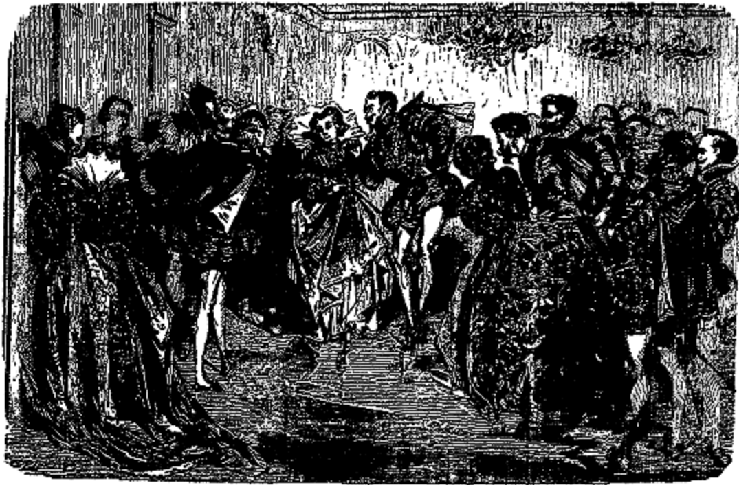
Chacun les regardait avec une admiration croissante.

Rosette et Charmant commencèrent; jamais on n'avait vu une danse plus gracieuse, plus vive, plus légère; chacun les regardait avec une admiration croissante. C'était tellement supérieur à la danse d'Orangine et de Roussette, que celles-ci, ne pouvant plus contenir leur fureur, voulurent s'élancer sur Rosette pour la souffleter et lui arracher ses diamants; le roi et la reine, qui ne les perdaient pas de vue et qui devinèrent leurs intentions, les arrêtrèrent et leur dirent à l'oreille: