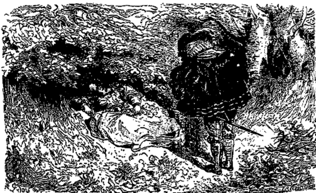
Il vit une petite fille endormie.

Ourson fit un pas vers elle; aussitôt la terreur de la petite prit le dessus; elle poussa un cri aigu et chercha encore à se relever pour fuir.