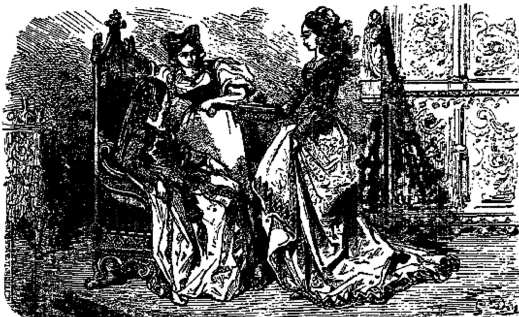
Voici une cassette de pierres précieuses.

par son dévouement d'être seule initiée à ce mystère; à elle vous pouvez toujours tout confier. Adieu, reine; comptez sur ma protection; voici une bague que vous allez passer à votre petit doigt; tant qu'elle y sera, vous ne manquerez de rien.»