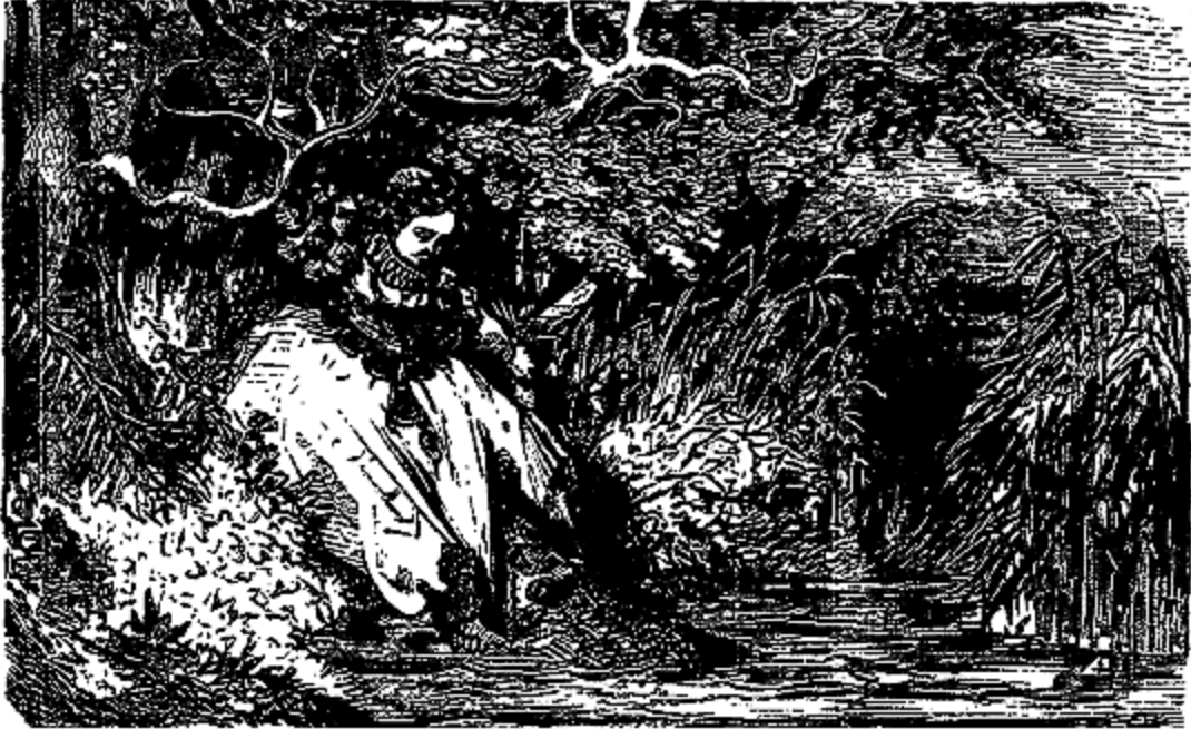
Rêve de Violette

l'eau: pauvre Violette tomber et appeler Ourson. Et bon Ourson venir et sauver Violette. Et Violette bien aimer bon Ourson, continua-t-elle d'une voix attendrie; Violette jamais oublier bon Ourson.»