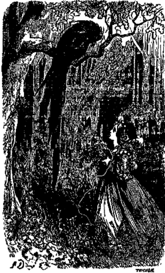
Le perroquet la pressait vivement d'avancer.

«Nous voici arrivés, Blondine; voici l'enclos où est la Rose.»