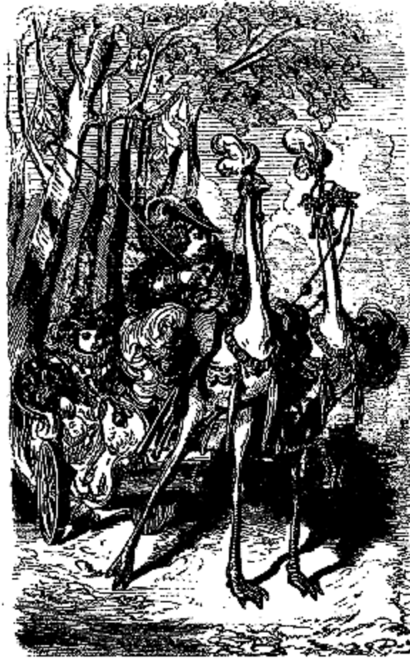
Sa voiture était attelée de deux autruches.

—Ah! tu ne le peux? Alors, adieu; je ne te donnerai plus aucune friandise, et je défendrai que personne dans la maison ne t'en donne jamais.