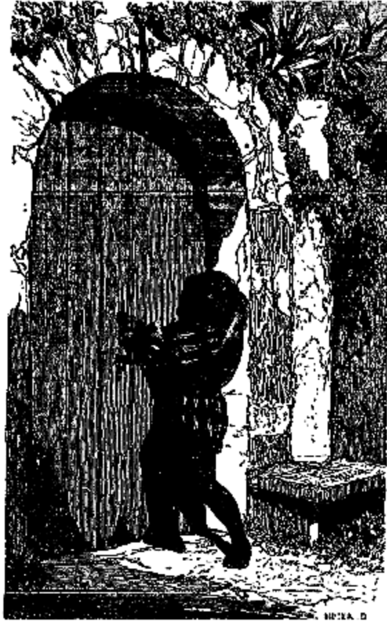
Mais ourson ne put ouvrir la porte.

de Passerose, ils arrivèrent à terre au moment où l'échelle et le grenier devenaient la proie des Flammes.