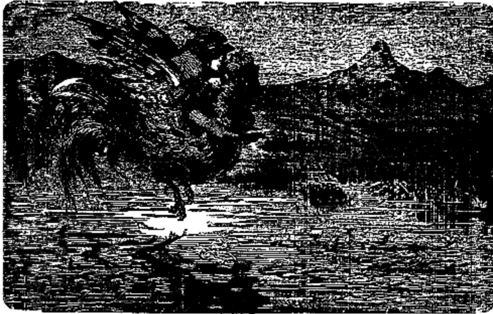
La rivière était si large qu'il vola pendant vingt et un jours.

se mit résolument à couper le blé. Il y passa cent quatre-vingt-quinze jours et autant de nuits.