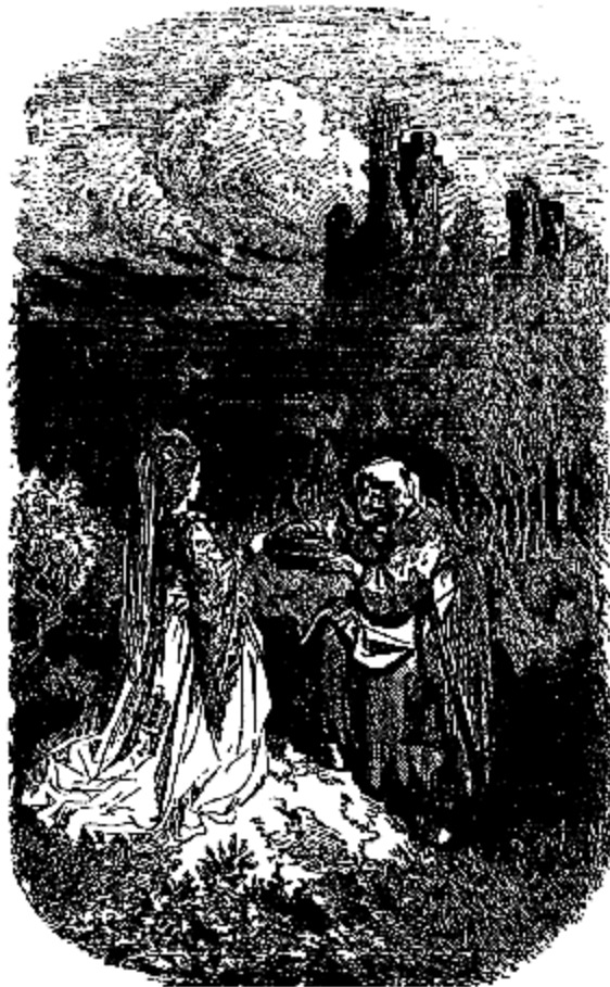
La vieille lui remet la cassette.

En effet, elle ne la regarda plus et tâcha de n'y plus penser; elle ferma les yeux, résolue d'attendre ainsi le retour du jour.