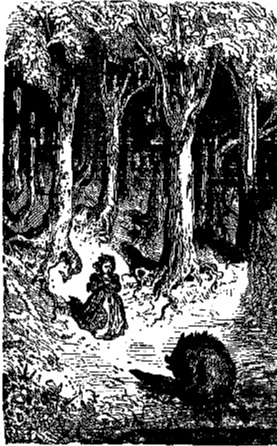
Pendant qu'elle hésitait, le Sanglier l'aperçut.

Violette appelait à son secours son frère, son Ourson chéri. A chaque nouvelle attaque du Sanglier, elle renouvelait ses cris; mais Ourson était bien loin, il n'entendait pas: personne ne venait à son aide.