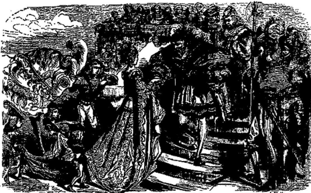
Le prince vint au-devant de la princesse Fourbette.

«Je t'aime bien, Gourmandinet, mais je n'aime pas à te voir si gourmand. Je t'en prie, corrige-toi de ce vilain défaut, qui fait horreur à tout le Monde.»