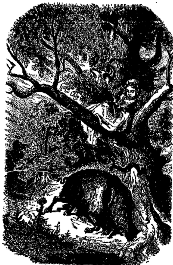
Le Sanglier se précipita contre l'arbre.

La violence de l'attaque renversa Ourson. Le Sanglier, voyant son ennemi à terre, ne lui donna pas le temps de se relever, et, sautant sur lui, le laboura de ses défenses et chercha à le mettre en pièces.