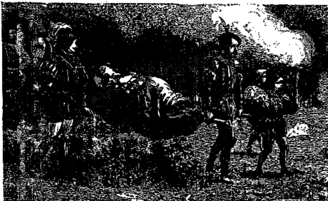
A ce moment, Rosalie semble rêver.

Elle alla à la fenêtre; elle vit des hommes d'armes, des officiers parés de brillants uniformes. De plus en plus surprise, elle allait appeler un de ces hommes qu'elle croyait être autant de génies et d'enchanteurs, lorsqu'elle entendit marcher; elle se retourna et vit le prince Gracieux, qui, revêtu d'un élégant et riche costume de chasse, était devant elle, la regardant avec admiration. Rosalie reconnut immédiatement le prince de son rêve, et s'écria involontairement;