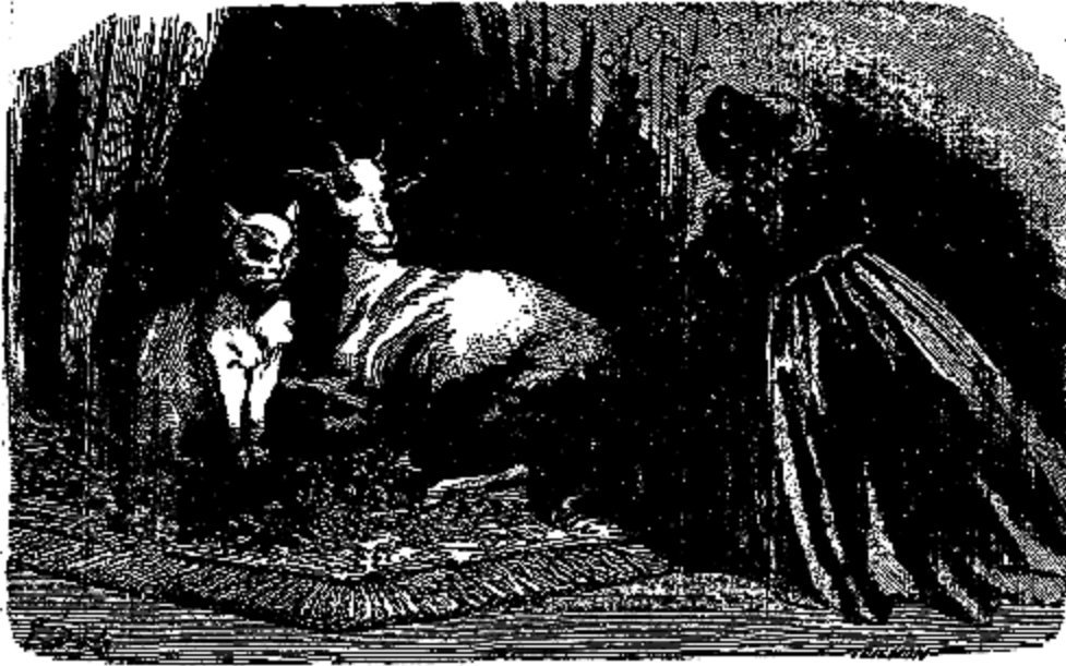
Elle aperçut une biche blanche.

se sentait instruite; elle se souvenait d'une foule de livres qu'elle croyait avoir lus pendant son sommeil; elle se souvenait d'avoir écrit, dessiné, chanté, joué du piano et de la Harpe.