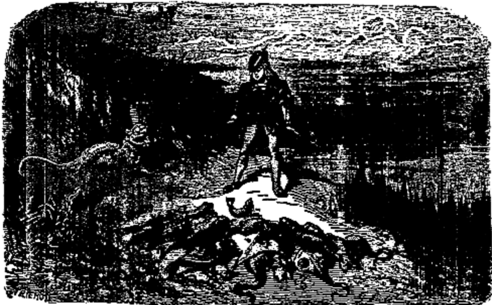
Voici, Monseigneur, tous vos poissons.

«Voici, Monseigneur, lui dit Henri, tous vos poissons cuits et salés. Veuillez tenir votre promesse et me faire passer à l'autre bord.»