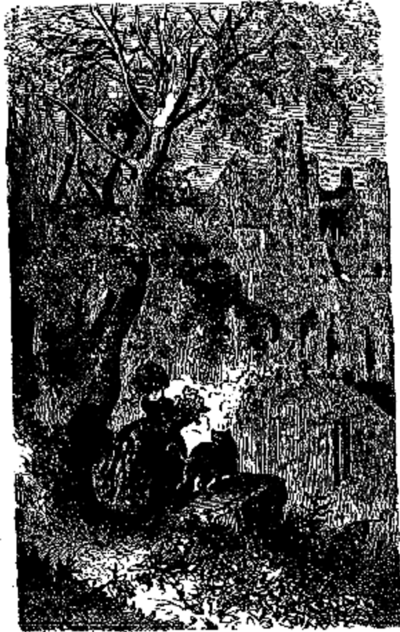
Blondine aperçut un magnifique château.

—Il m'est défendu de répondre à cette question, chère Blondine. Plus tard vous le saurez. Mais voici l'heure du dîner; venez, Blondine, vous devez avoir appétit.»