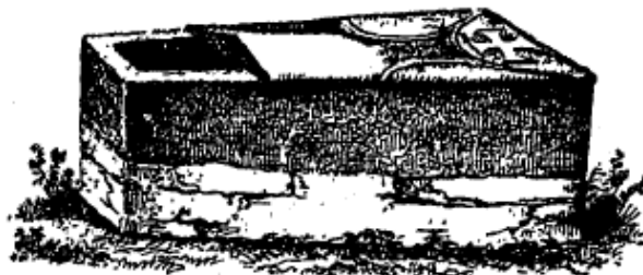
Tombeau de saint Benoît, dans le cimetière de Macerac.

leur demeure dans les constructions destinées à devenir l'église, malgré saint Benoît qui ne put les chasser et les détruire complètement. Alors, croyant voir un avertissement dans ce fait de la Providence, il se résigna à bâtir plus loin son oratoire, et alla en poser les premières pierres, non loin de sa fontaine, dans un lieu qui, dit-on, n'était alors que forêt, et près de l'endroit où avaient été construites tout d'abord les cellules de ses neuf compagnons. Ainsi prirent naissance le prieuré et le bourg de Macerac.