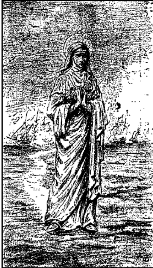
Les «sentes» de la mer, dessin de PAUL CHARDIN.