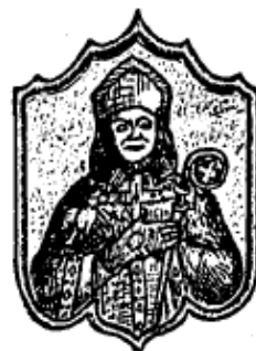
Partie supérieure de la pierre tombale de saint Lunaire

Au temps jadis, quand saint Lunaire vint prêcher la religion chrétienne sur les côtes de Bretagne, il apportait avec lui une pierre sacrée, pour la placer sur l'autel qu'il voulait ériger. Mais il la perdit, et comme il ne pouvait la retrouver, il était chagrin et se tourmentait beaucoup. Alors il se mit à prier Dieu, et une colombe la lui rapporta. C'est alors qu'il commença à construire une église.