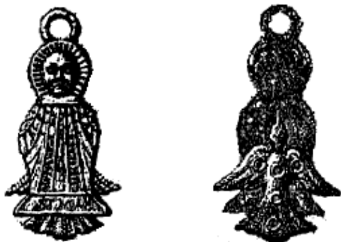
Plomb de saint Mathurin Il est représenté vu de face et de dos avec le Saint-Esprit, c'est le modèle ancien et il n'est plus en usage.]