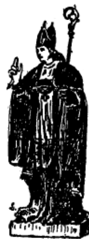
Ancienne statue de saint Briac.

Il bâtit l'église de Lancieux, qui était jadis sur une butte, auprès du moulin de la Touche, sur la route de Ploubalay. Quelque temps après la mort de saint Cieux, on transporta son corps dans l'église qu'il avait bâtie; mais le lendemain, on le trouva sur le bord de la falaise. On le rapporta plusieurs fois dans l'église, mais comme on le retrouvait toujours le lendemain au bord de la mer, on comprit qu'il voulait que l'église fût à l'endroit où on la voit aujourd'hui; dès que le corps du saint eut été mis dans l'église neuve, il resta tranquille dans sa tombe.