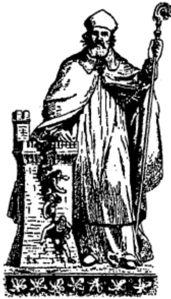
Saint Melaine et les prisonniers dessin de BUSNEL.

«Après la veillée funèbre solennellement célébrée à Plaz par les évêques et le clergé, on déposa le lendemain matin le corps du pieux pontife dans une grande barque, où entrèrent les trois évêques et le prêtre Marcus. D'autres barques suivaient, chargées de peuple, chargées de prêtres, chargées des moines de Plaz chantant des psaumes et des litanies. Tout ce funèbre cortège remonta la Vilaine jusqu'à Rennes et vint prendre terre au sud de l'agglomération qui formait alors cette ville, vers le point aujourd'hui occupé par l'escalier du Cartage ou le bas de la rue de Rohan.