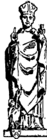
Statue de saint Méen, église de Paimpont xv e siècle.

La statue que nous reproduisons est dans l'église de Paimpont, abbaye qui dépendait de celle de saint Méen; elle porte sur sa base les armoiries de l'abbé Olivier Guiho qui est agenouillé aux pieds du saint. Dans la sacristie un reliquaire d'argent renferme des reliques du saint: il a la forme d'une main avec l'avant-bras, tenant un livre à fermoirs dont les sculptures sont dorées. L'autre statuette que l'on voit ci-dessous en compagnie de celles de saint Lubin et de saint Mamère est dans la chapelle de N.-D. du Haut près Moncontour.