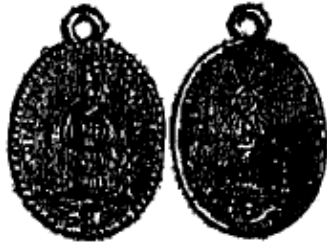
Ancienne médaille de saint Mathurin en plomb. (Pèlerinage de la Pentecôte à Moncontour).

Saint Amateur guérit aussi les enfants du mal Saint-Aragon. On voit dans l'église de Bléruais (Ille-et-Vilaine) une statue de saint Amateur, à laquelle on fait des pèlerinages le 15 août; il guérit des rhumatismes.