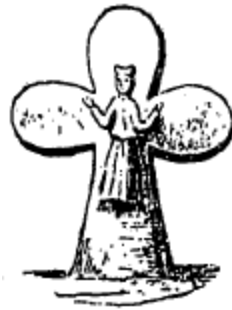
Croix de la partie française du Morbihan, d'après ROSENZWEIG, Les Croix de pierre du Morbihan.

Achévé d'imprimer le dix-sept avril mil huit cent quatre-vingt-dix-sept