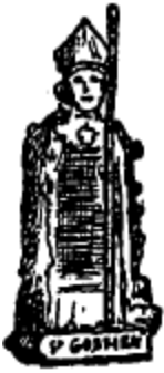
Statue de saint Gobrien à l'intérieur de la chapelle à Saint-Servan: elle forme le couronnement d'un contrefort.

répéter partout qu'en construisant un nouvel édifice, le pieux évêque voulait réduire à rien leur ancien bourg, dont les habitants, ne voyant plus venir la même quantité de monde à l'office de leur église, seraient bientôt réduits à la mendicité. Ils résolurent donc de s'en venger, et un jour que le saint évêque était occupé à charroyer de la pierre pour la construction de sa chapelle, ils profitèrent de ce que, accablé par la chaleur du jour, il avait mis quelques instants ses bœufs à se reposer à l'ombre et s'était endormi à côté d'eux, pour lui jouer un mauvais tour. S'approchant en sourdine des pauvres animaux, avec leurs faux à la main, ils tranchèrent d'un seul coup les fesses des bœufs de saint Gobrien. Mais le saint fut réveillé aussitôt par les mugissements de son attelage, et, indigné de la méchanceté d'un peuple auquel il ne voulait que du bien, il montra aux coupables l'iniquité de leur action et leur prédit que la Providence à sa prière priverait à l'avenir tous les descendants des paroissiens de Saint-Servant de la partie du corps qu'ils avaient voulu retrancher à ses bœufs. Saint Gobrien remit alors en place le fessier à ses animaux, mais depuis ce temps, tous les Servantais durent se passer du leur.