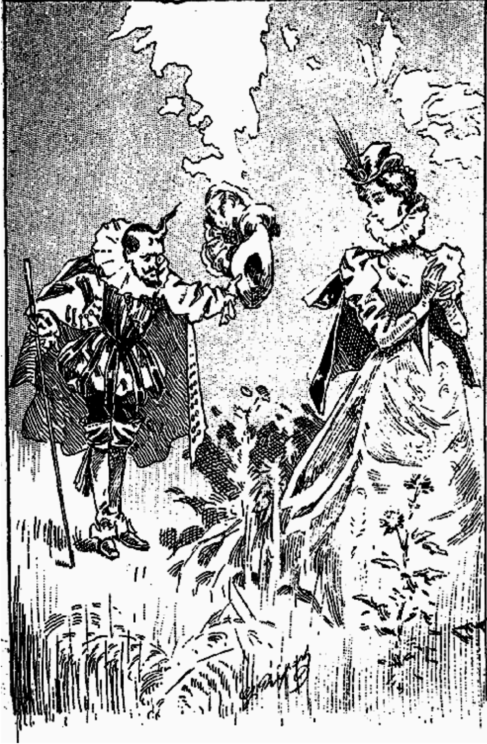
Riquet à la Houppe aborda la princesse avec toute la politesse imaginable.