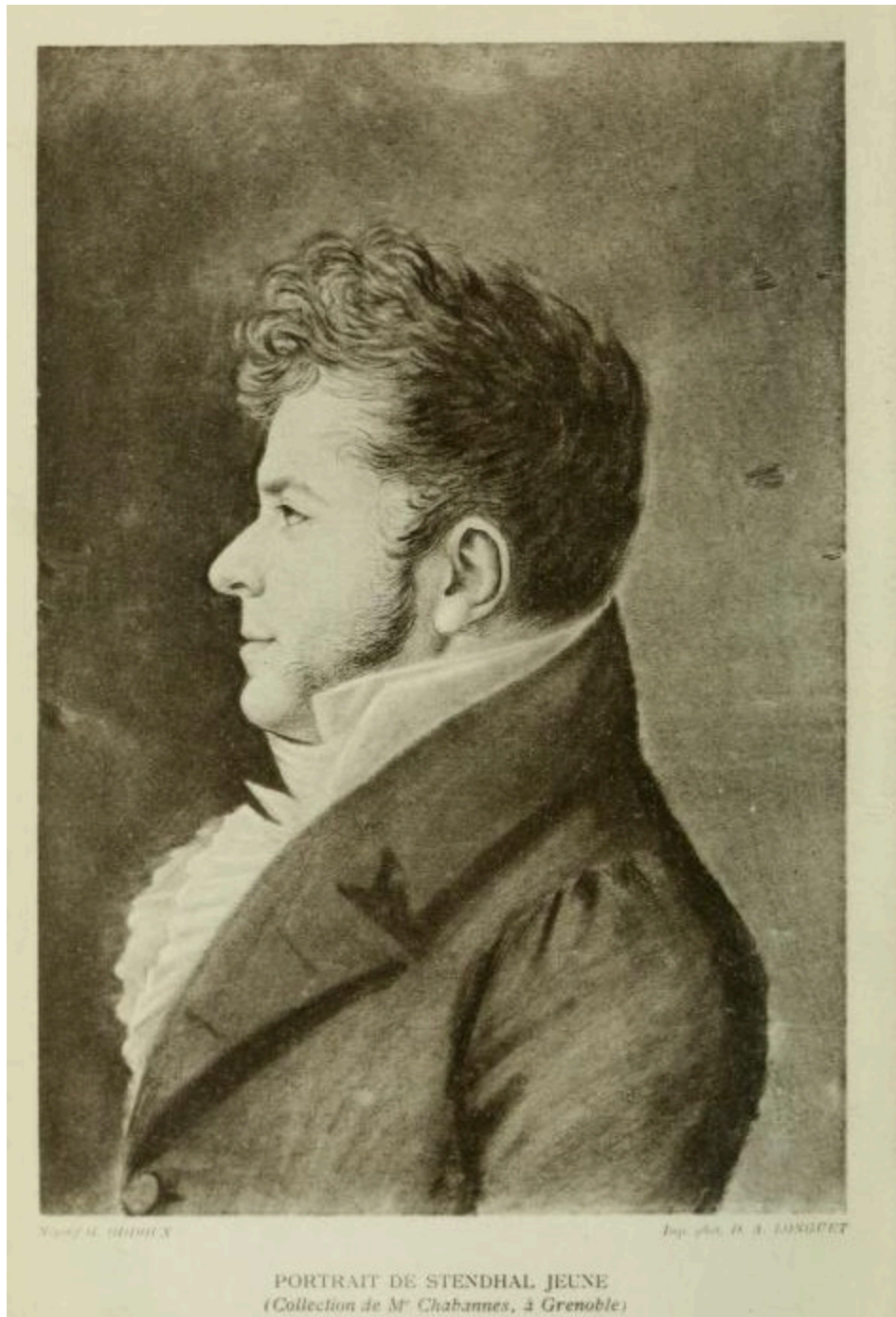
Portrait de Stendhal jeune.