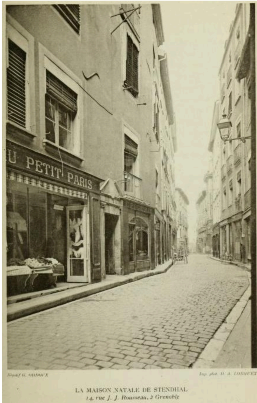
LA MAISON NATALE DR STENDHAL 14 rue J. J. Rousseau, à Grenoble